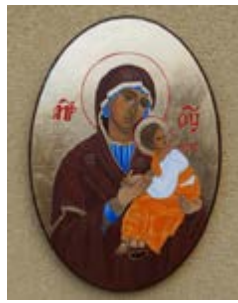
Matka Boska Nieustającej Pomocy na desce 24x35x1,5