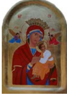
Matka Boska Nieustającej Pomocy. Ikona na desce lipowej ok. 29x42x3 cm