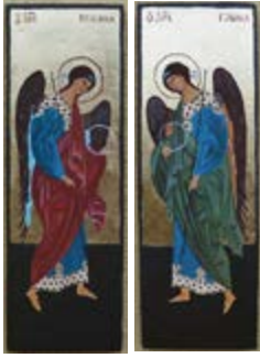
Archanioł Michał (od lewej) i Archanioł Gabriel. Ikony pisane temperą jajową desce lipowej ok.