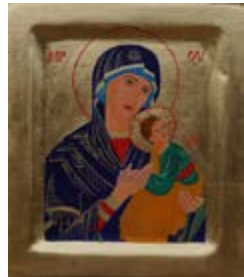
Matka Boska Nieustającej Pomocy. Ikona ręcznie pisana temperą jajową 21x24x3,2 cm