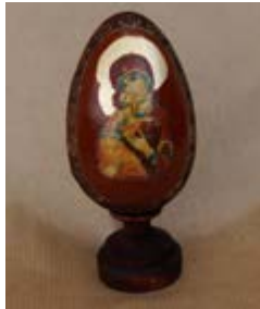
Matka Boska z Dzieciątkiem. Pisane jajko wielkanocne