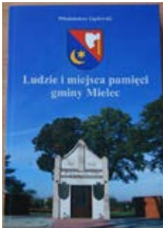
Ludzie i miejsca pamięci gminy Mielec. Włodzimierz Gasiewski. Mielec 2015. Format 23,5 x 16 cm, stan bdb, nowa, 204 strony

Nasze Ikony są pisane w technikach tradycyjnych oraz własnych i są nie tylko świętymi obrazami, ale także przekazem ich wykonawcy, który przez sztukę także wyraża swoją wiarę i wrażenia estetyczne. Wykonujemy także Ikony na zamówienie. Możliwe jest przesłanie własnego wzoru oraz wypisanie lub grawerowanie dedykacji!