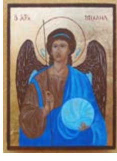
„Archanioł Michał” na desce ok. 23,5x31x2,8 cm