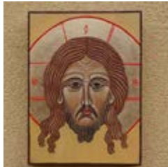
Mandylion. Ikona ręcznie pisana, tempera 15,5x20,5