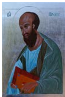
„Święty Paweł” Ikona na desce sosnowej ok. 20,5x30,5x2,4 cm