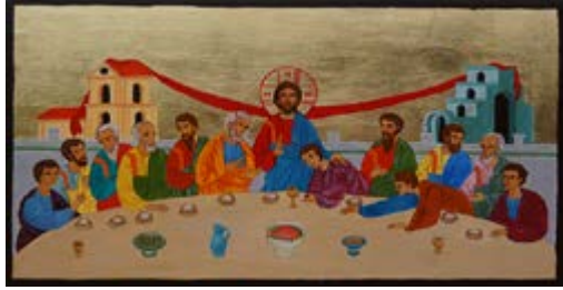
Ostatnia Wieczerza. Ikona ręcznie pisana na desce sosnowej ok. 36,5x22,5x2,7 cm.