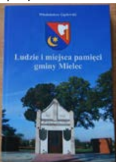
Ludzie i miejsca pamięci gminy Mielec. Włodzimierz Gąsiewski. Mielec 2015. Format 23,5 x 16 cm, stan bdb, nowa, 204 strony