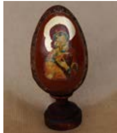
Matka Boska z Dzieciątkiem pisane jajko wielkanocne