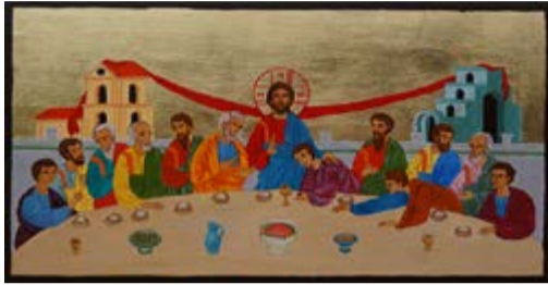
Ostatnia Wieczerza. Ikona ręcznie pisana na desce sosnowej ok. 36,5x22,5x2,7 cm.