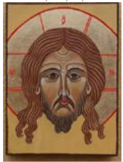
Mandylion Ikona ręcznie pisana, tempera 15,5x20,5