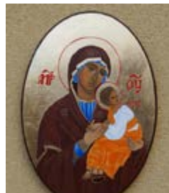
Matka Boska Nieustającej Pomocy na desce 24x35x1,5