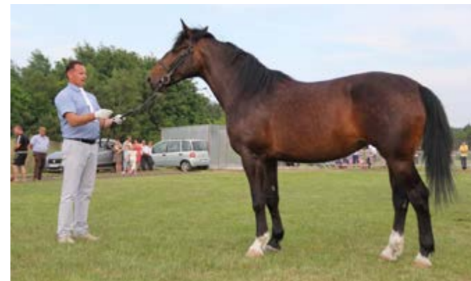
Jedna z czempionek.

Te widowiskowe zawody obejrzało w sumie około 2,5 tysiąca widzów. Jak zwykle dostarczyły one wiele emocji. W amatorskich zawodach powożenia zaprzęgami parokonnymi z dużymi końmi wygrał Wojciech Poźdał z luzakim Jackiem Poźdałem z Podlesia, któremu pokonanie parkuru o długości 350 metrów z 11 przeszkodami zajęło bez żadnego błędu nieco ponad dwie minuty (2:03;25).