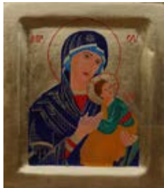
Matka Boska Nieustającej Pomocy Ikona ręcznie pisana temperą jajową 21x24x3,2 cm