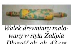
Walek drewniany malowany w stylu Żalipia Długość ok. ok. 43 cm

Waga PWW PRZEMYSŁ 5 kg + miska metalowa stan dobry