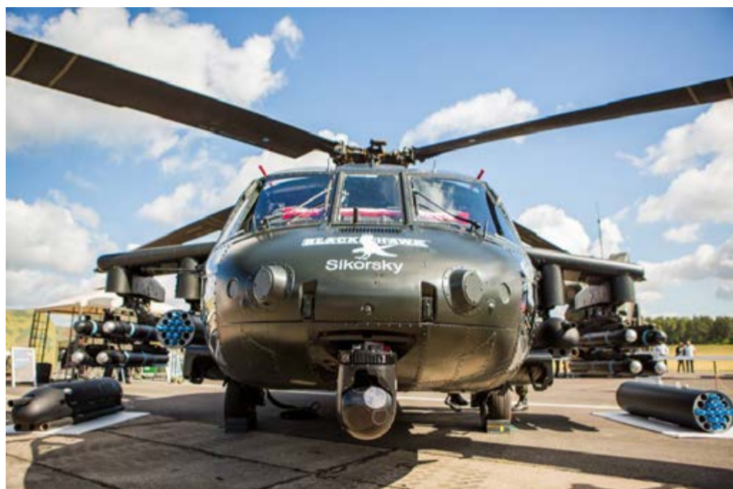
Uzbrojony Black Hawk.