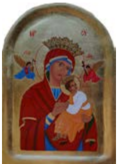
Matka Boska Nieustającej Pomocy. Ikona na desce lipowej ok. 29x42x3 cm