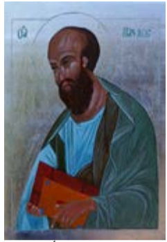
„Święty Paweł” Ikona na desce sosnowej ok. 20,5x30,5x2,4 cm