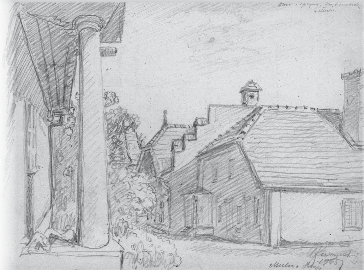
Dwór i oficyna hr. Oborskiego w Mielcu - 1945 r. Władysław Żurawski, rysunek ołówkiem, kopia zb. wł.