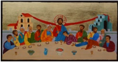
Ostatnia Wieczerza. Ikonka ręcznie pisana na desce sosnowej ok. 36,5x22,5x2,7 cm.