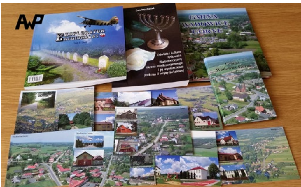
Na zdjęciu nasze niektóre tegoroczne publikacje!

Więcej szczegółów na stronie: http://promocja.mielec.pl/czy-mielczanie-maja-wplyw-na-wybor-projektu-nowej-hali-sportowej/