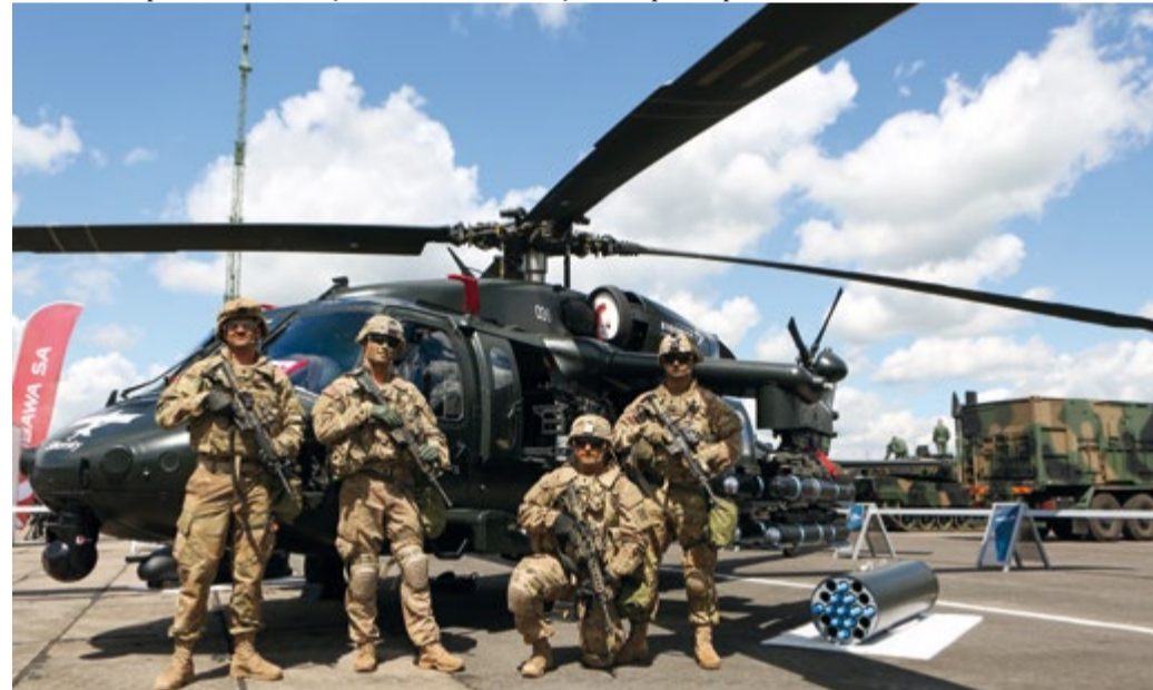
Uzbrojony Black Hawk na ćwiczeniach „Anakonda”

BH to pewność oparta na doświadczeniu operacyjnym/bojowym. BLACK HAWK jest synonimem słowa PEWNY. Helikopter BLACK HAWK zasłużył na zaufanie wojskowych przez 35 lat służby, podczas których maszyny te wylatały ponad 1 000 milionów