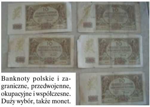
Banknoty polskie i zagraniczne, przedwojenne, okupacyjne i współczesne. Duży wybór, także monet.