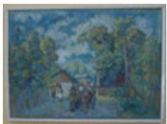
Zaprzęg konny, pejzaż wiejski, Henryk Momot 1952 r. Obraz olejny ok. 82,5x60 cm.