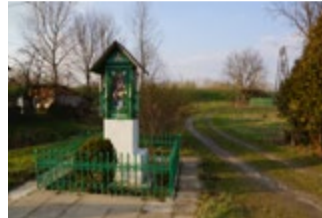
Kapliczka Chrystusa w Gawłuszowicach, gdzie wg legendy kazania głosił św. Wojciech

Św. Wojciech na obrazie w ołtarzu głównym kościoła w Gawłuszowicach. W związku z tym można sądzić, że do Złotnik zarówno drogą wodną przez Wisłę i Wisłokę, jak też i również traktem lądowym mogło docierać złoto i srebro do wyrobu kosztowności.