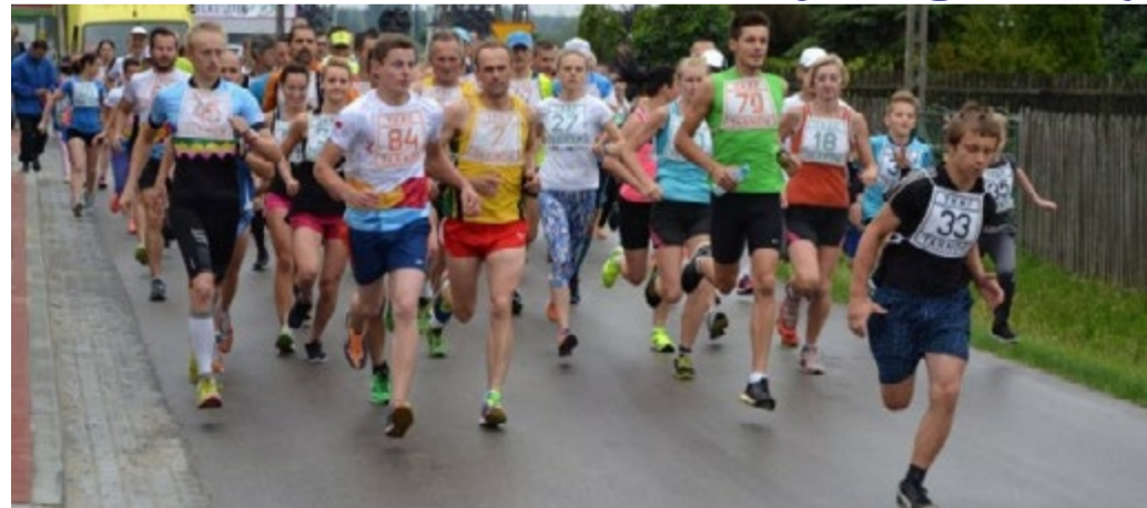
Uczestnicy Ogólnopolskiego Biegu Radomyskiego im. Jacka Koziola