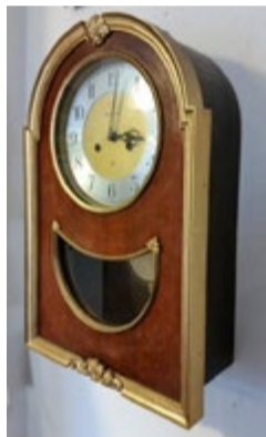
Zegar ścienny ZSRR. JAN-TAR socrealizm. Mechanizm tradycyjny. Zegar jest sprawny, bije godziny i półgodziny. Chociaż wymaga przeglądu i ingerencji zegarmistrza. Gabaryty ok. 33x51x15,5 cm.