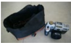
Aparat fotograficzny AUTOMATIC CAMERA, sprawny po włożeniu baterii działa, przyciski, zoom, jest uchwyt pod lampę błyskową, torbai paski.