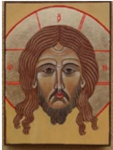
Mandylion Ikonka ręcznie pisana, tempera 15,5x20,5