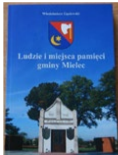
Ludzie i miejsca pamięci gminy Mielec. Włodzimierz Gąsiewski. Mielec 2015. Format 23,5 x 16 cm, stan bdb, nowa, 204 strony

Tylko u nas największa oferta wydawnictw regionalnych i nie tylko! Mielec ul. Sobieskiego 1 17 5831498