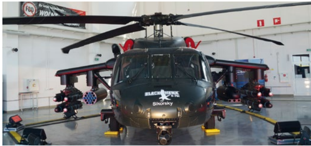
Uzbrojony Black Hawk na prezentacji w PZL Mielec

PZL Mielec jest obecnie największym zakładem produkcyjnym Lockheed Martin poza USA posiadającym w pełni funkcjonalną linię produkcyjną końcowego montażu, centrum wykończeniowe i lotnicze centrum operacyjne, zdolne do produkowania 24 helikopterów BLACK HAWK rocznie. W razie potrzeby możemy również zwiększyć moce produkcyjne. W PZL Mielec produkujemy całą maszynę, od najdrobniejszych komponentów po montaż finalny, testy i akceptację klienta. Gwarantujemy również obsługę posprzedażną u