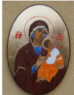
Matka Boska Nieustającej Pomocy na desce 24x35x1,5