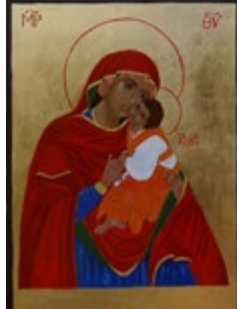
Matka Boska Łopieńska Dobrej Miłości Bieszczadzka