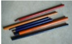
Stare OŁÓWKI GRAFITOWE KOPIOWE, zestaw 6 ołówków, 3 nieużywane, BENSIN BROS. AND DEENEY, PIAST 282, OMNIUM CEDRUS 259. CZARNA PERELKA KOPIOWY ŚREDNI,