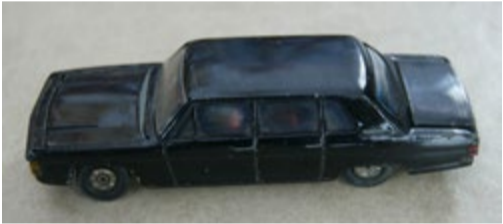
Samochód model kolekcjonerski GAZ-14 CZAJKA ZSRR. Model skala 1:43 metalowy, odchylana kłapa silnika i bagażnika. Koła resorowane. Produkcja ZSRR. Sprzedamy lub kupimy inne modele, nie tylko samochodów.