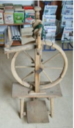
Stary kołowrotek drewniany. Częściowo sprawny, działa ale, ma chyba nie wszystkie części. Drewno lipowe ma otwory po kornikach, na łączeniach jest dość luźny. Drewno jest także nieco przybrudzone i splekane. Ma ok. 104 cm wysokości, ok. 48 szerokości i 40 cm głębokości.