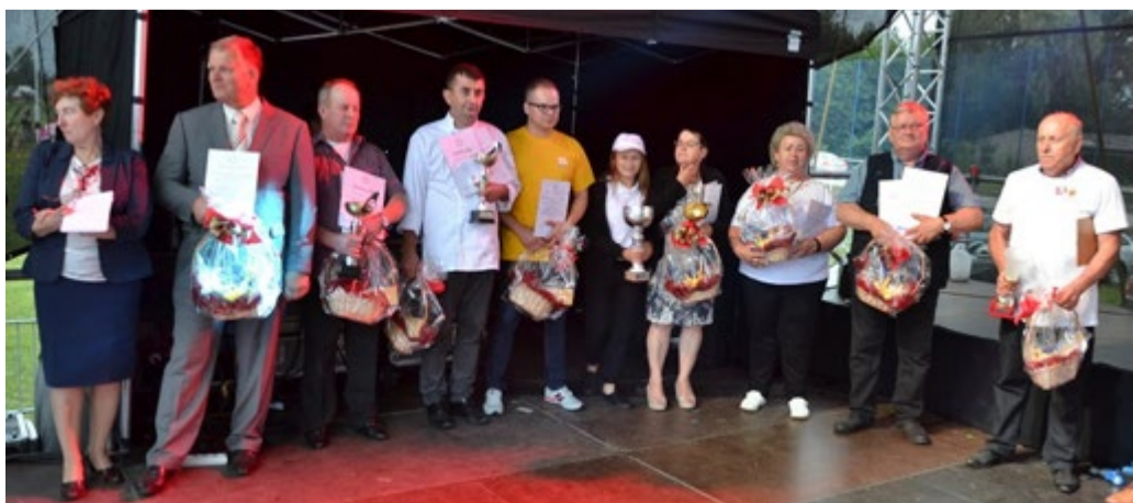
Nagrodzeni w konkursie „Podkarpackie smaki”