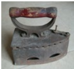
STARE ŻELIWNE ŻELAZKO, wysokość 22 cm, szerokość 9 cm, długość 20 cm.