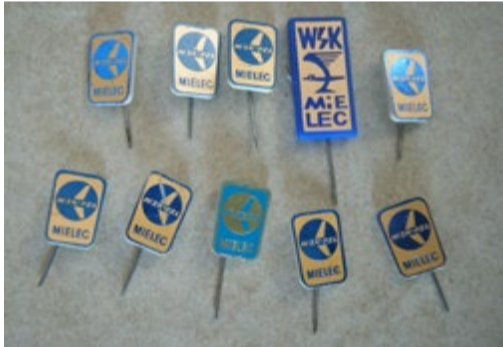
WSK PZL Mielec zestaw 10 plaketek. Posiadamy także inne odznaki metalowe i proporzyczki.