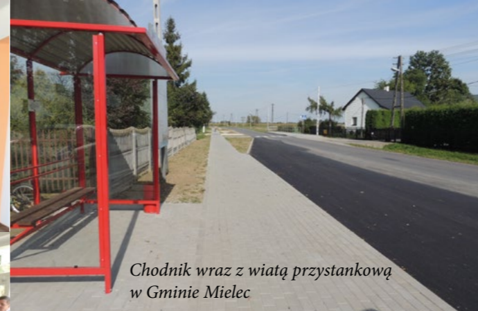
Chodnik wraz z wiatą przystankową w Gminie Mielec