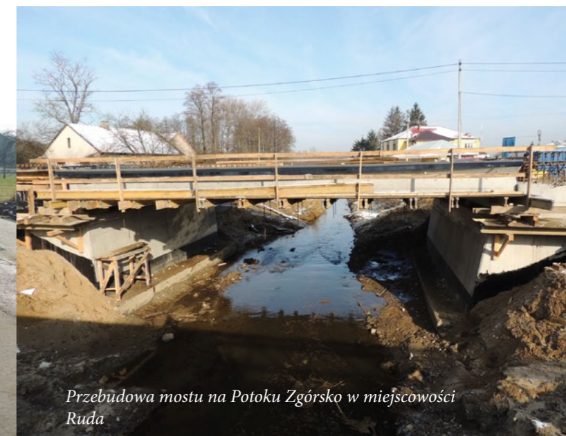
Przebudowa mostu na Potoku Zgórsko w miejscowości Ruda