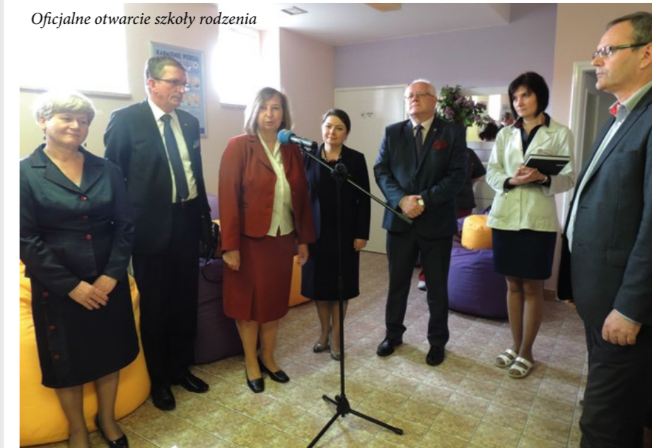
Oficjalne otwarcie szkoły rodzenia

http://www.powiat-mielecki.pl/pl/20/20/art3452.html