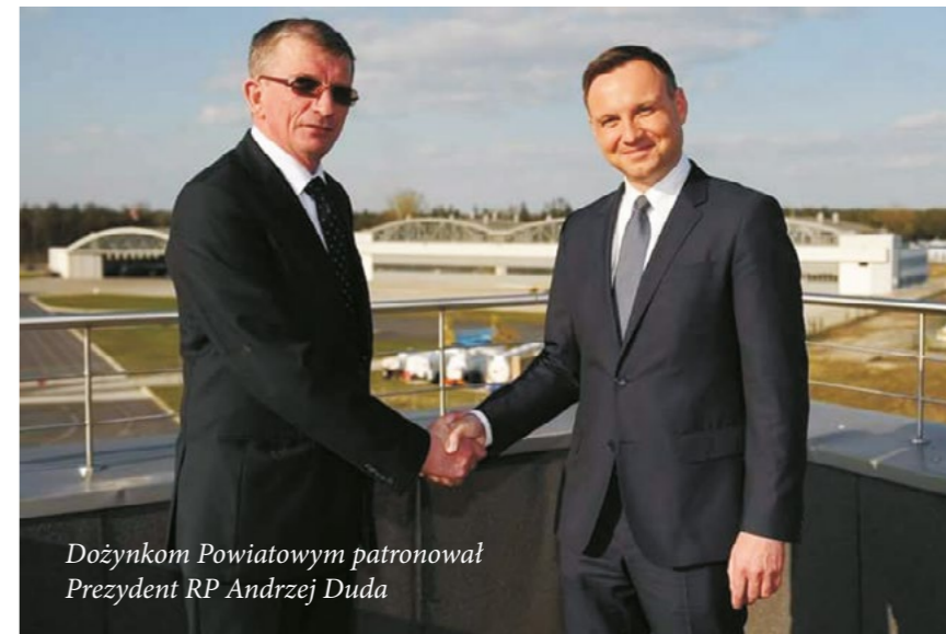
Dożynkom Powiatowym patronował Prezydent RP Andrzej Duda

Narodowy Patronat na Dożynkami Powiatu Mieleckiego objął Prezydent RP Andrzej Duda. http://www.powiat-mielecki.pl/pl/20/20/art3592.html