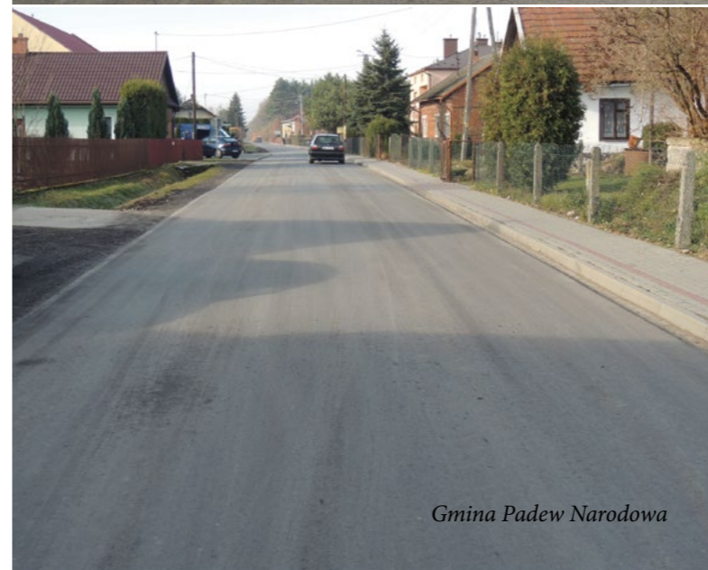
Gmina Padew Narodowa