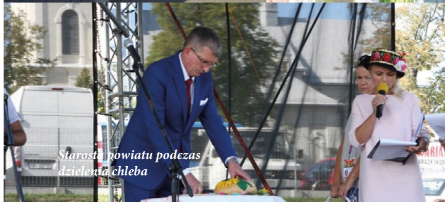
Starosta powiatu podczas dzielenia chleba