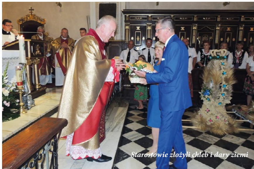
Starostowie złożyli chleb i dary ziemi