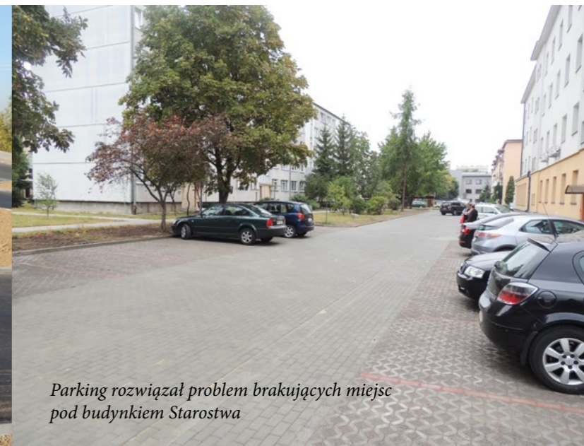
Parking rozwiązał problem braku miejsc pod budynkiem Starostwa