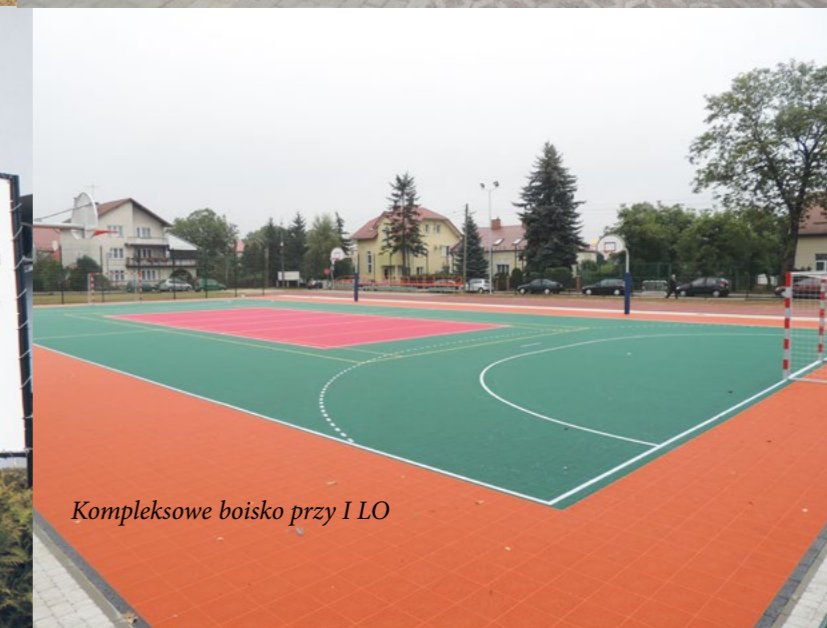
Kompleksowe boisko przy I LO