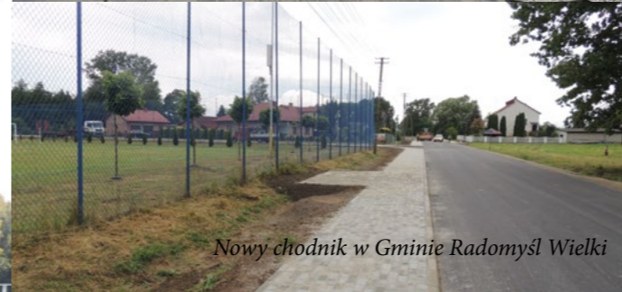
Nowy chodnik w Gminie Radomyśl Wielki