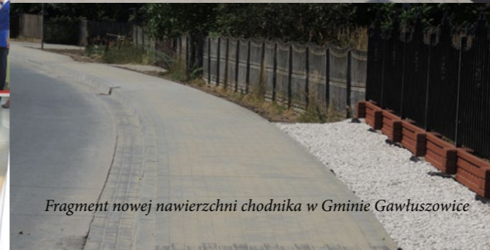
Fragment nowej nawierzchni chodnika w Gminie Gawłuszowice