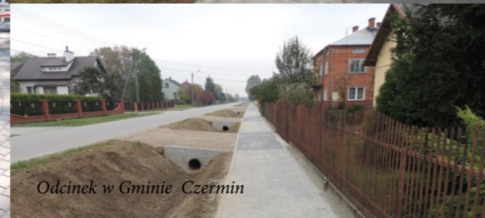
Odcinek w Gminie Czermin