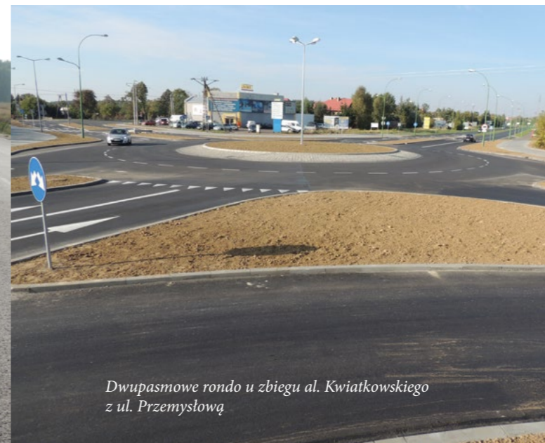
Dwupasmowe rondo u zbiegu al. Kwiatkowskiego z ul. Przemysłową