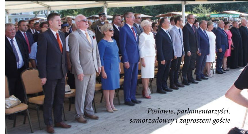
Posłowie, parlamentarzyści, samorządowcy i zaproszeni goście