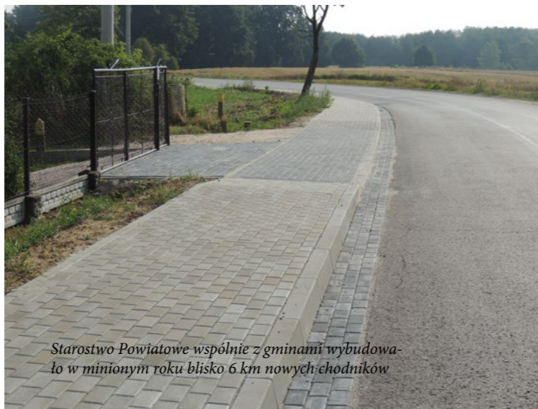
Starostwo Powiatowe wspólnie z gminami wybudowało w minionym roku blisko 6 km nowych chodników