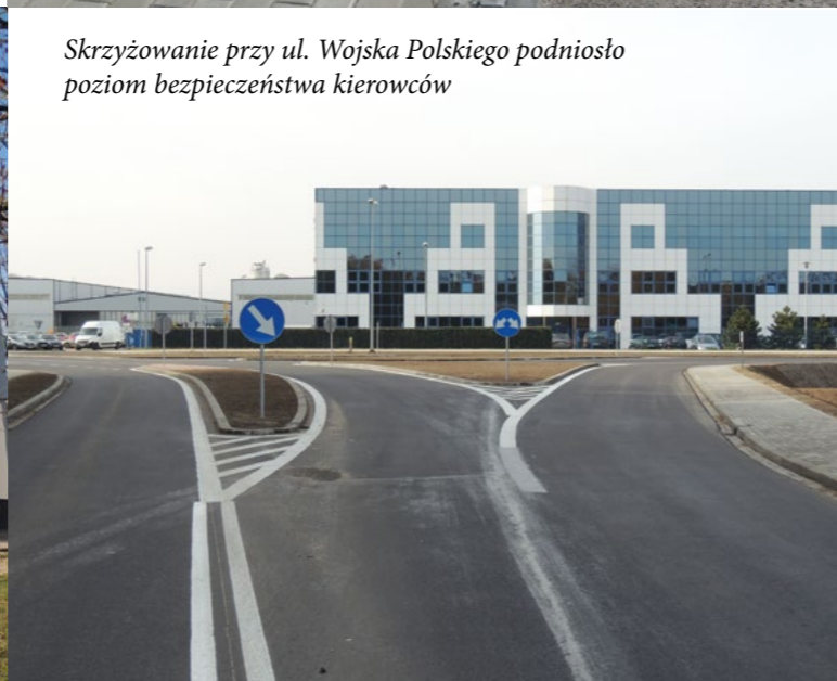
Skrzyżowanie przy ul. Wojska Polskiego podniosło poziom bezpieczeństwa kierowców