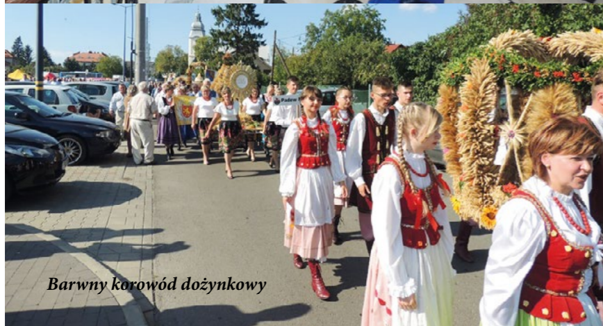
Barwny korowód dożynkowy