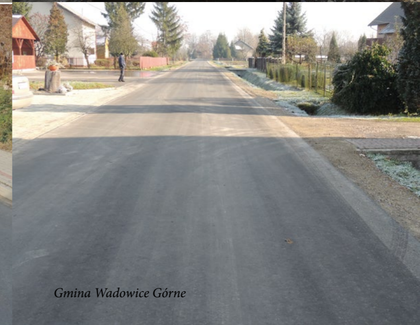
Gmina Wadowice Górne