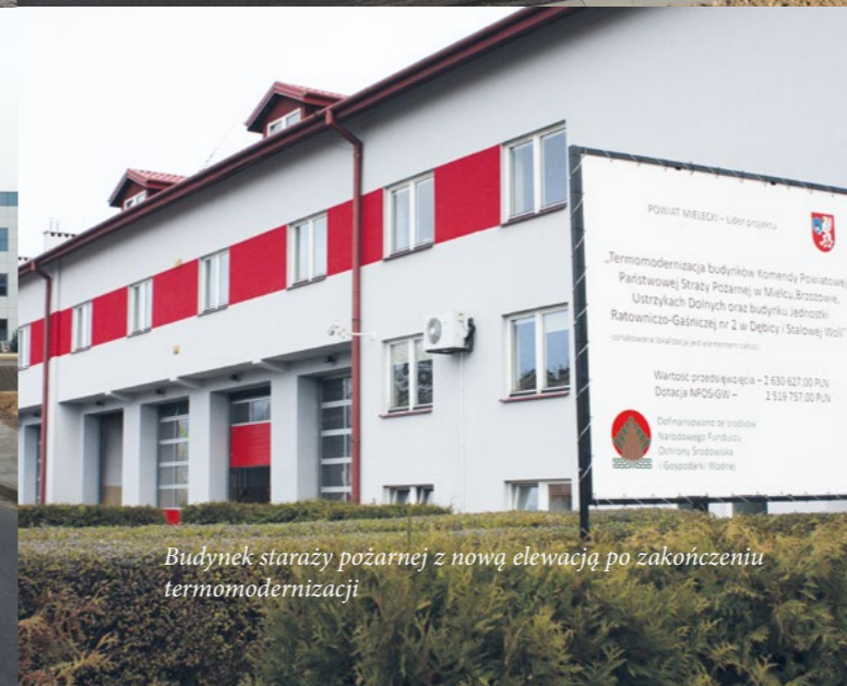
Budynek stacji pożarnej z nową elewacją po zakończeniu termomodernizacji