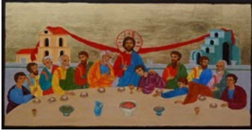
Ostatnia Wieczerza. Ikonka ręcznie pisana na desce sosnowej ok. 36,5x22,5x2,7 cm.

Ikonki wystawiamy od 2001 r. Nasze Ikonki są pisane w technikach tradycyjnych oraz własnych i są nie tylko świętymi obrazami, ale także przekazem ich twórcy, który przez sztukę także wyraża swoją wiarę i wrażenia estetyczne. Wykonujemy także Ikonki na zamówienie. Możliwe jest przesłanie własnego wzoru oraz wypisanie lub grawerowanie dedykacji! Zapraszamy: