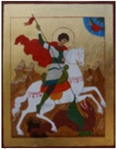
ŚW. JERZY WALCZĄCY ZE SMOKIEM Ikonka pisana, tempera, deska 32x41,5