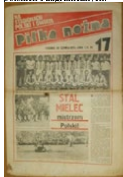
Tygodnik „Piłka Nożna” 26 czerwca 1973, nr 17, w numerze m.in.: STAL MIELEC mistrzem Polski!