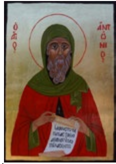
Święty Antoni Ikonka pisana na desce lipowej 21x30