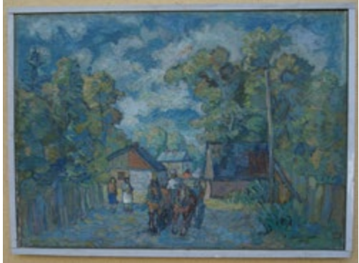
Zaprzęg konny, pejzaż wiejski. Henryk Momot 1952 r. Obraz olejny ok. 82,5x60 cm.