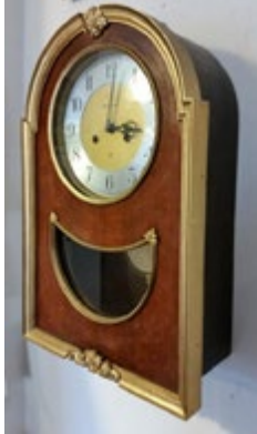
Zegar ścienny ZSRR. JAN-TAR socrealizm. Mechanizm tradycyjny. Zegar jest sprawny, bije godziny i półgodziny. Chociaż wymaga przeglądu i ingerencji zegarmistrza. Gabaryty ok. 33x51x15,5 cm.