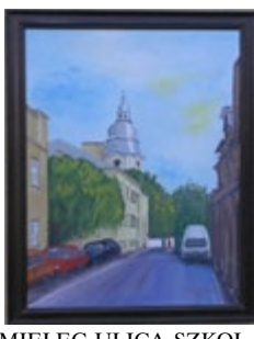
MIELEC ULICA SZKOLNA I BAZYLIKA ŚW. MATEUSZA, olej, płótno 42x45 cm w drewnianej ramie 48x60 cm, podpisany i datowany, wykonany w 1999 r.