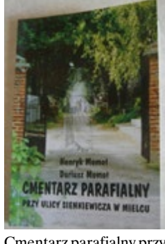
Cmentarz parafialny przy ul. Sienkiewicza w Mielcu Henryk Momot, Dariusz Momot, „Cmentarz parafialny przy uli Sienkiewicza w Mielcu”. Mielec 2001. Format 14,5x20,5 cm, 309 stron. Stan bdb.