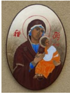
Matka Boska Nieustającej Pomocy na desce 24x35x1,5