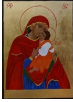
Matka Boska Łopieńska Dobrej Miłości Bieszczadzka