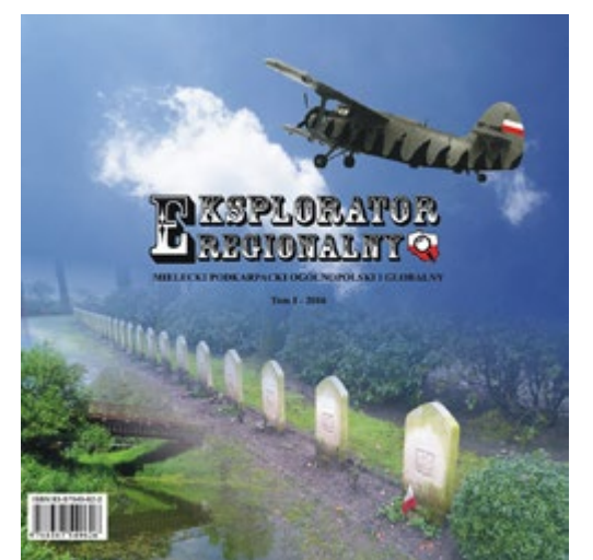
Tom 1 - Mielec 2016. Format 21x21 cm, 184 strony, w tym kilkadziesiąt kolorowych, plany, mapki, tłumaczenia rozkazów niemieckich i wiele innych rewelacji!