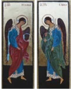
Archanioł Michał (od lewej) i Archanioł Gabriel Ikonki pisane temperą jajową na desce lipowej.