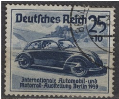
Niemcy DR Volkswagen Międzynarodowa Wystawa Samochodów i Motocykli Berlin 1939. Katalog Michel nr 668 (str. 86, wyd. 1983). Posiadamy na sprzedaż zbiory starych znaczków polskich i zagranicznych.