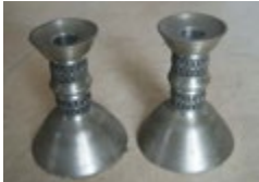
2 świeczniki odwrócony kielich Graal z reliefami. Mają bardzo ciekawy i oryginalny wygląd przypominający odwrócony kielich typu Graal. Kolumna zdobiona tłoczonymi reliefami. Średnica podstawy 9,5 cm, średnica kolumny z reliefami ok. 3,2 - 3,6 cm, średnica kołnierza ok. 5,5 cm, średnica gniazda na świeczkę ok. 2 cm. W gnieździe na świeczkę sygnatury. Świeczniki są wykonane z białego metalu nieżelaznego przypominającego srebro. Wewnątrz prawdopodobnie wypełnione gipssem. Na podstawie zielony plusz. Stan dobry, niewielkie przybrudzenia, zarysowania i zaśniedzenia.