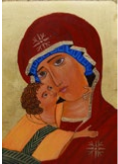
Matka Boska Włodzimierska Ikonka + złoto 24 karat