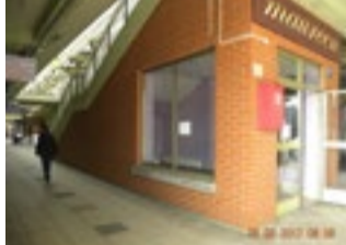
Wynajmę lokal na środku przejścia głównego w PASAŻU, 20 m2 + magazynek 9 m2 (gratis). Mielec, ul. Dworcowa 4/57a. Tel. 504 292110