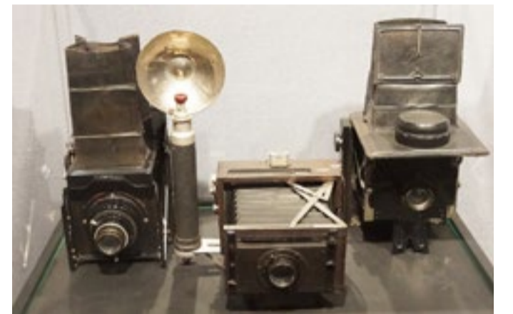
Fragment wystawionej kolekcji starych aparatów fotograficznych w Filii Muzeum Regionalnego w Mielcu „Jadernówka”