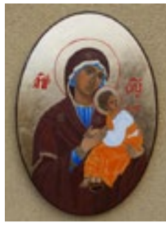
Matka Boska Nieustającej Pomocy na desce 24x35x1,5