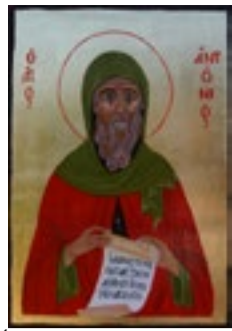
Święty Antoni Ikonka pisana na desce lipowej 21x30