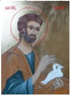
Św. Józef ikona, tempera na desce 15x21,5 cm