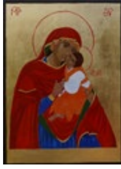
Matka Boska Łopieńska Dobrej Miłości Bieszczadzka