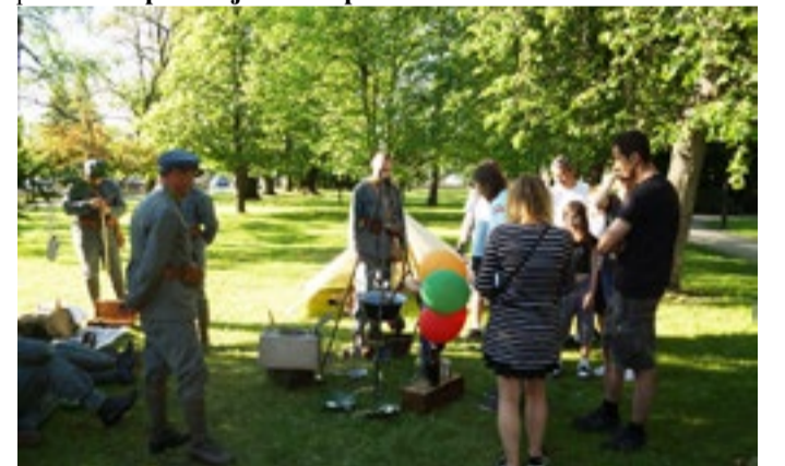
Biwak Przemyskiej Grupy Rekonstrukcji Historycznych X DOK w Parku Oborskich przy Muzeum Regionalnym w Mielcu.