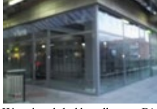
Wynajmę lokal handlowy w PASAŻU w Mielcu. Powierzchnia 80 metrów kwadratowych, II piętro, narożny od strony osiedla. Tel. 518 373 255