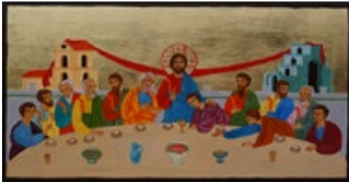
Ostatnia Wieczerza. Ikonka ręcznie pisana na desce sosnowej ok. 36,5x22,5x2,7 cm.