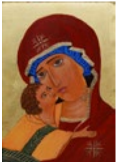
Matka Boska Włodzimierska Ikonka + złoto 24 karat