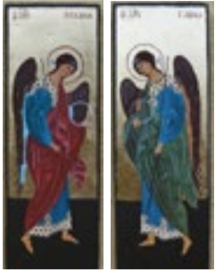
Archanioł Michał (od lewej) i Archanioł Gabriel Ikonki pisane temperą jajową na desce lipowej.