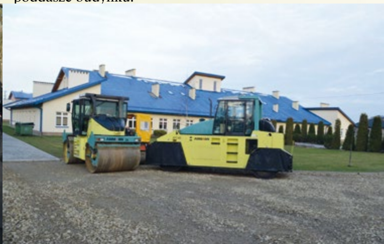
Prace drogowe przy obiekcie Publicznego Gimnazjum