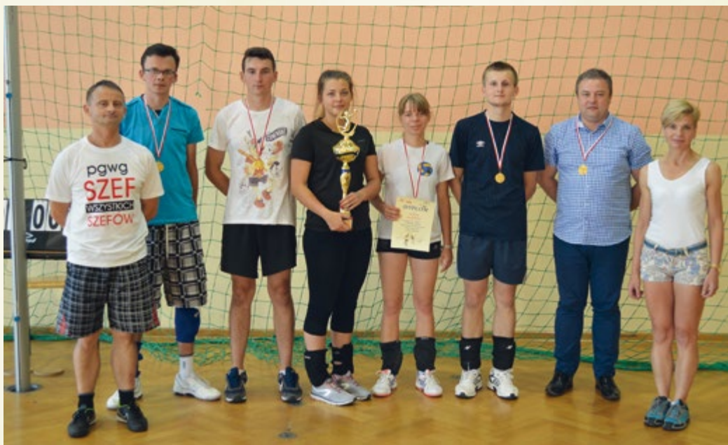
23 lipca 2016 r. Turniej piłki siatkowej o Puchar Wójta Gminy Wadowice Górne