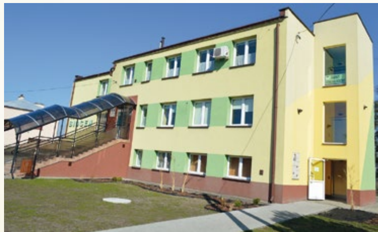
Siedziba NZOZ „BIOCEN” w Wadowicach Górnych