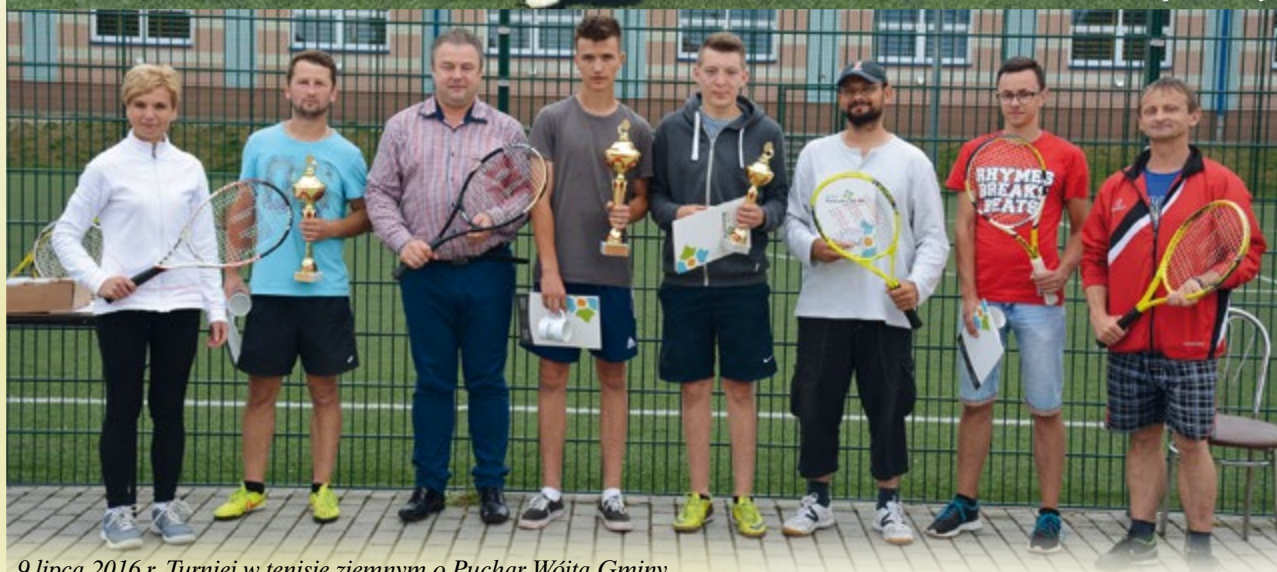
9 lipca 2016 r. Turniej w tenisie ziemnym o Puchar Wójta Gminy.