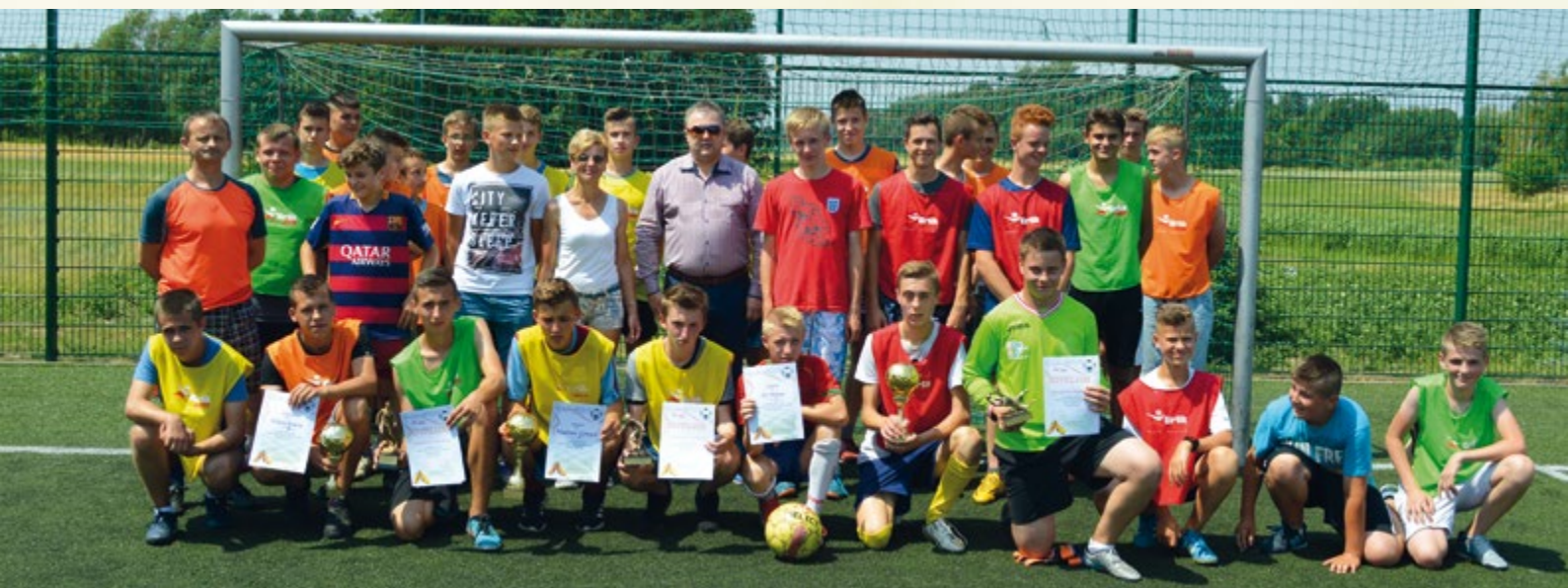
25 czerwca 2016 r. Turniej piłki nożnej o Puchar Wójta Gminy.