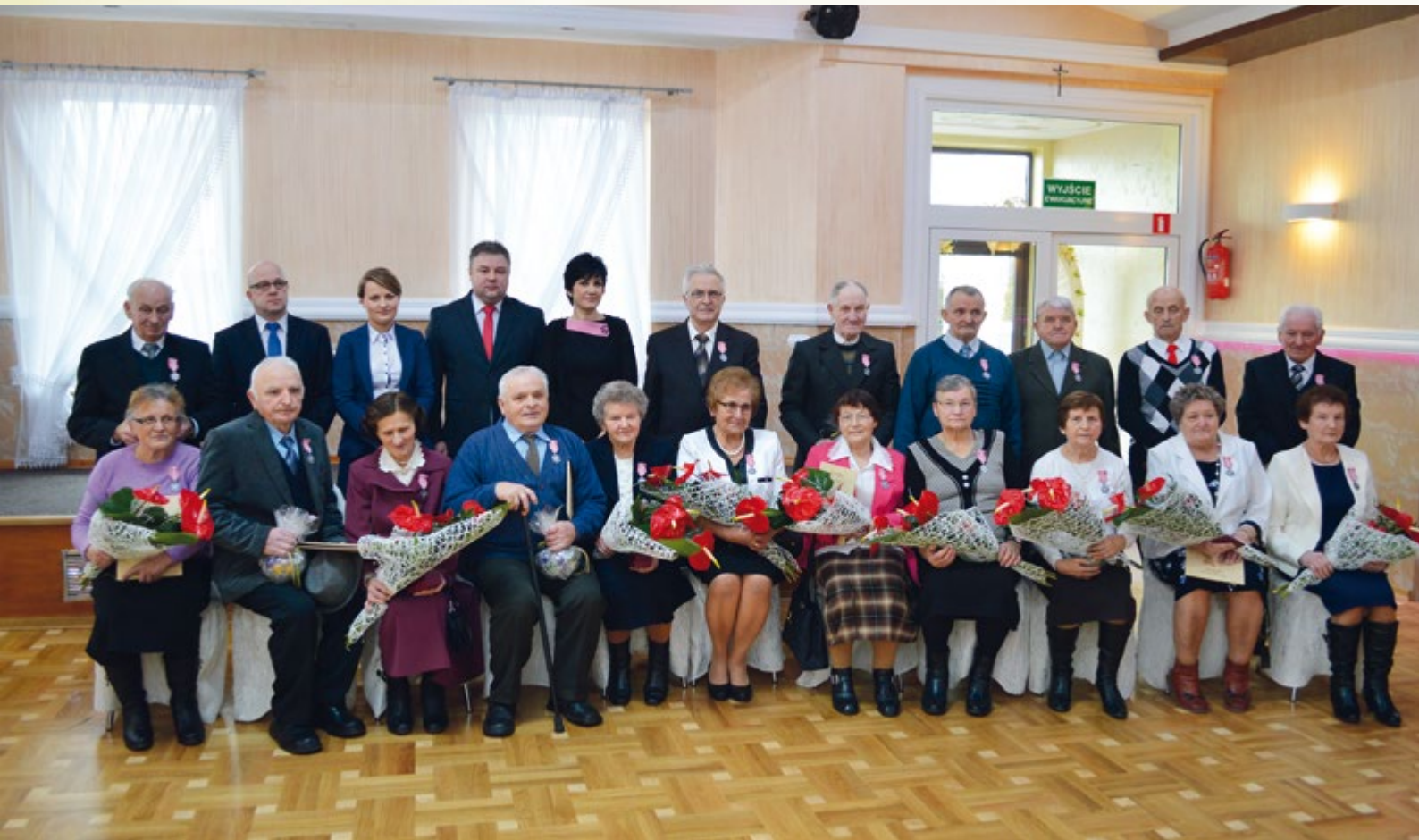
19 stycznia 2016 r., Wadowice Górne. Złoci jubilaci.