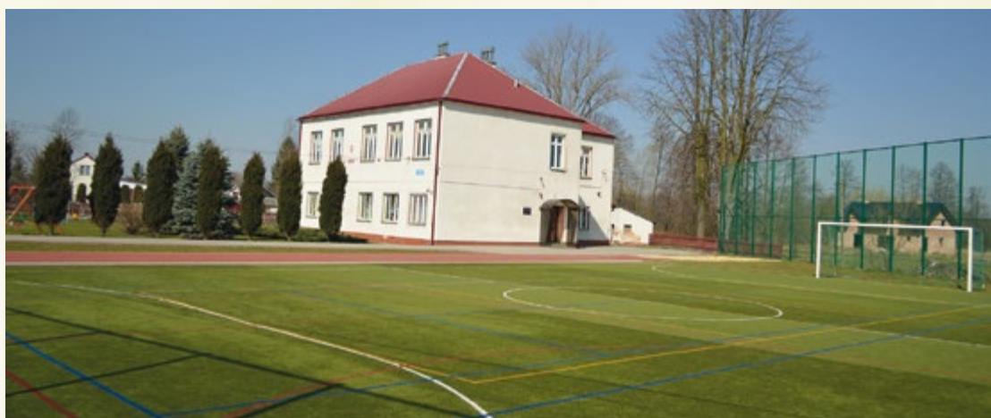
Boisko przy szkole podstawowej w Woli Wadowskiej. Urządzenia do rehabilitacji ruchowej przy szkole podstawowej w Woli Wadowskiej.