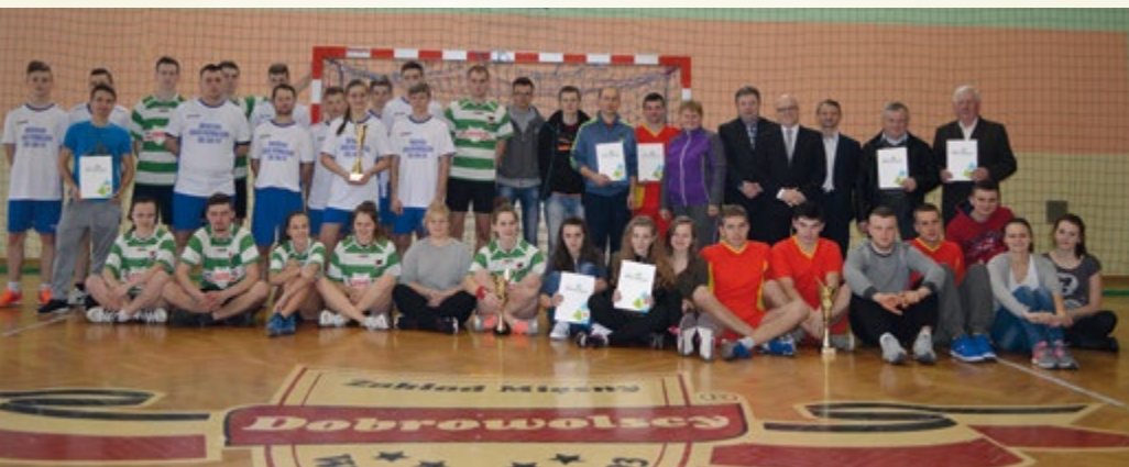
20 lutego 2016 r. Turniej piłki ręcznej o Puchar Wójta Gminy