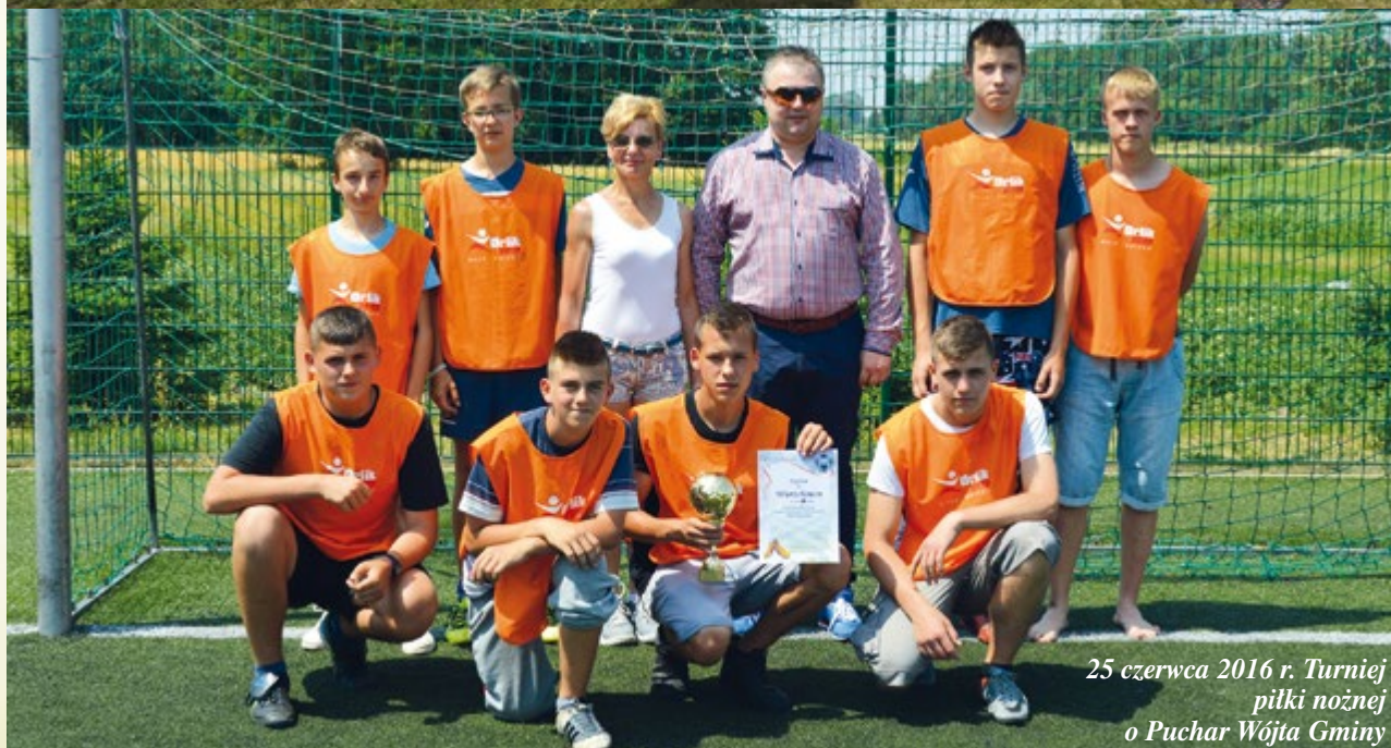
25 czerwca 2016 r. Turniej piłki nożnej o Puchar Wójta Gminy