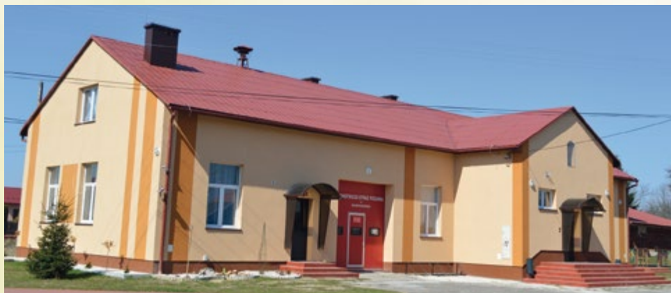
Dom Strażaka OSP Wampierzów

21 września 2016, druhowie OSP Wampierzów otrzymali od Gminy Wadowice Górne nową motopompę szlamową Hondę WT-30X (Koszt - 6 435,00 zł).