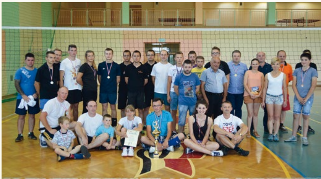
23 lipca 2016 r. Turniej piłki siatkowej o Puchar Wójta Gminy Wadowice Górne

W 2015 r. na pomoc stypendialną dla uczniów o charakterze socjalnym wykorzystana została kwota 125 640,63 zł w tym środki własne gminy w wysokości 25 128,63 zł, natomiast w 2016 r. 109 348,69 zł w tym środki własne gminy w wysokości 21 869,74 zł.