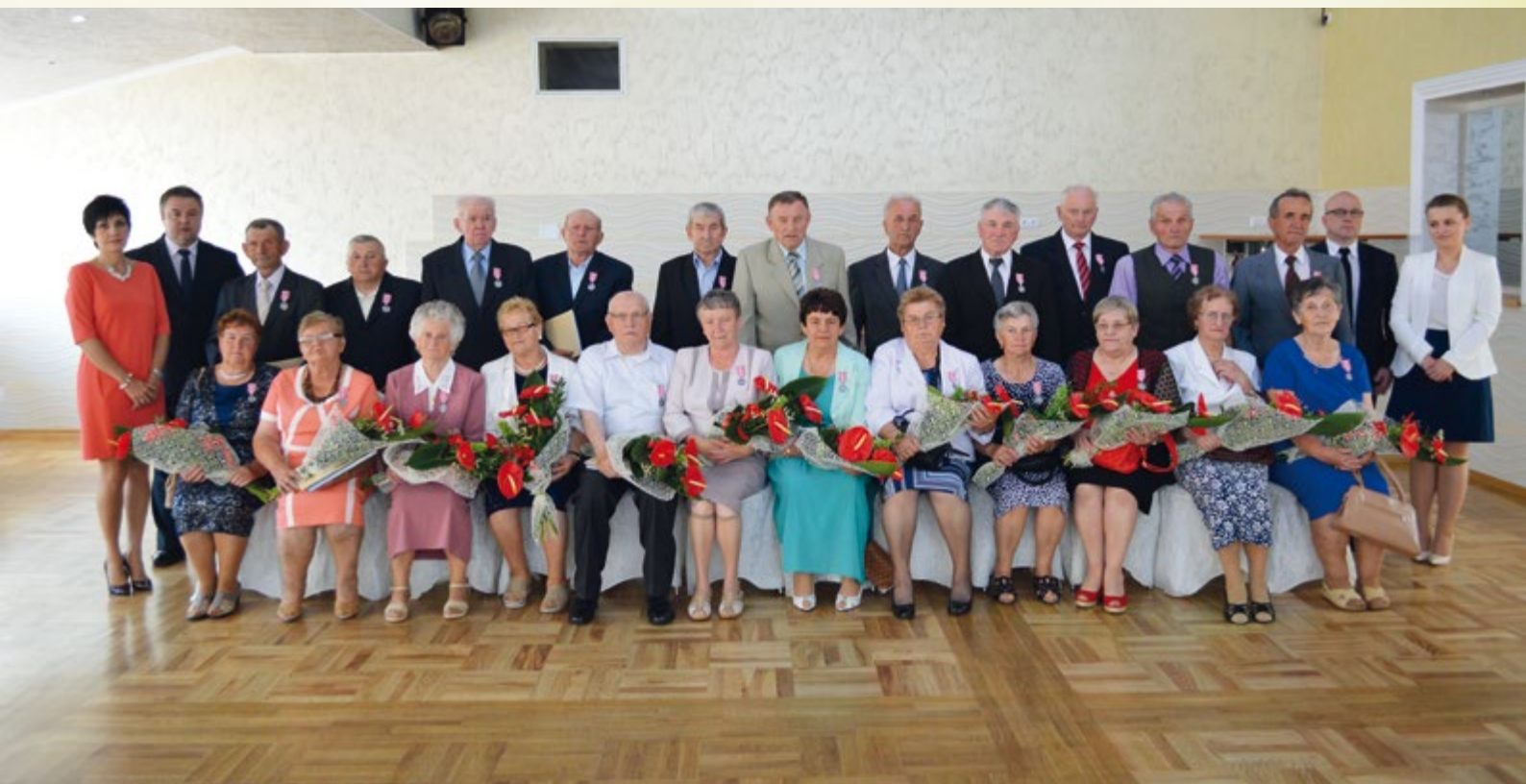
9 czerwca 2016 r., Wadowice Górne. Złoci jubilaci.