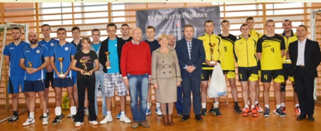
26 listopada 2016 r. Wadowice Górne, XIII jesienny Turniej Piłki Siatkowej o Puchar Wicestarosty Powiatu Mieleckiego.

W zabezpieczenie logistyczne Sztabu, obok OSP Wadowice Dolne, zaangażowane były jednostki Ochotniczych Straży Pożarnych z: Jam, Wadowic Górnych, Kawęczyna, Wampierzowa oraz Grzybowa. Podczas 23 finału (2015 r.) wolontariusze zebrali 25 832,45 zł. Rok później, była to kwota 32 178,39 zł, a w roku 2017 – 37 035,22 zł.