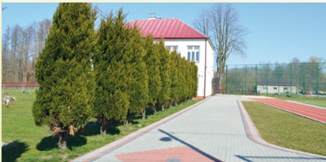
Wjazd do Szkoły Podstawowej w Woli Wadowskiej