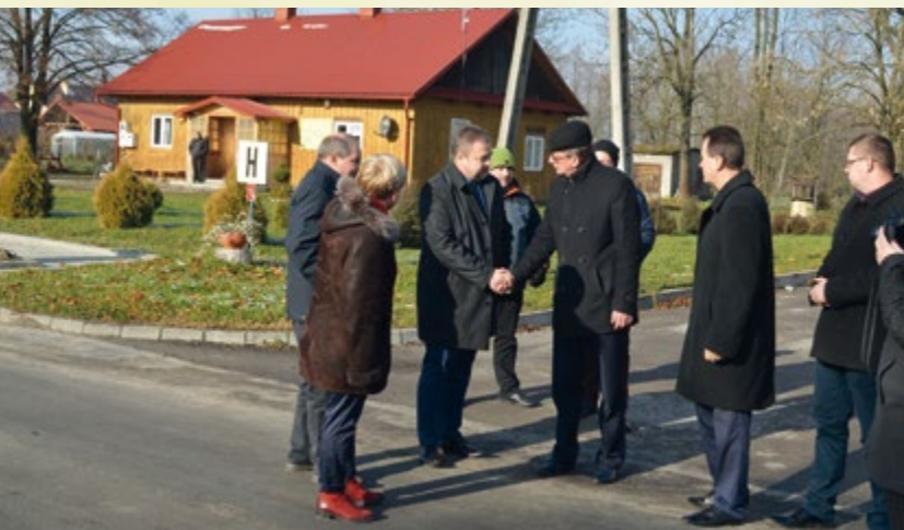
15 listopada 2016 r. Oddanie do użytku odremontowanego odcinka nawierzchni drogi powiatowej Trzciana – Kawęczyn.

W latach 2015-2016 na modernizację Domu Ludowego w Zabrnium wydatkowano 53 510,85 zł. W ramach tej kwoty zagospodarowane zostało poddasze budynku.