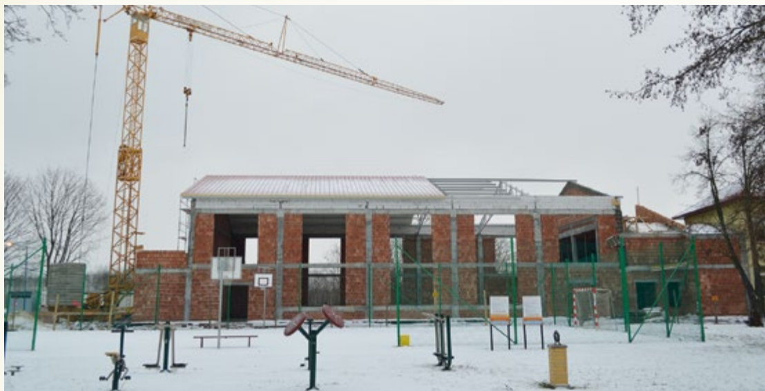
Budowa sali widowiskowo-sportowej w Wadowicach Dolnych

Łącznie na zadania w zakresie kultury fizycznej w latach 2015-2016 wydatkowano z budżetu Gminy Wadowice Górne 191 720,11 zł.