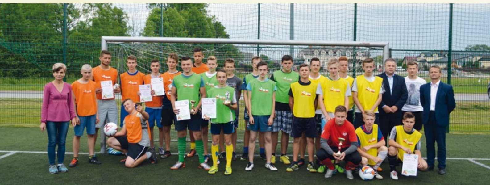
16 czerwca 2017 r. Turniej piłki nożnej uczniów gimnazjum o Puchar Wójta Gminy.