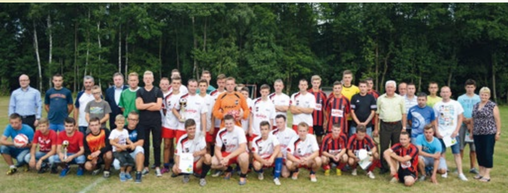
2 sierpnia 2015 r. Turniej piłki nożnej o Puchar Wójta Gminy.