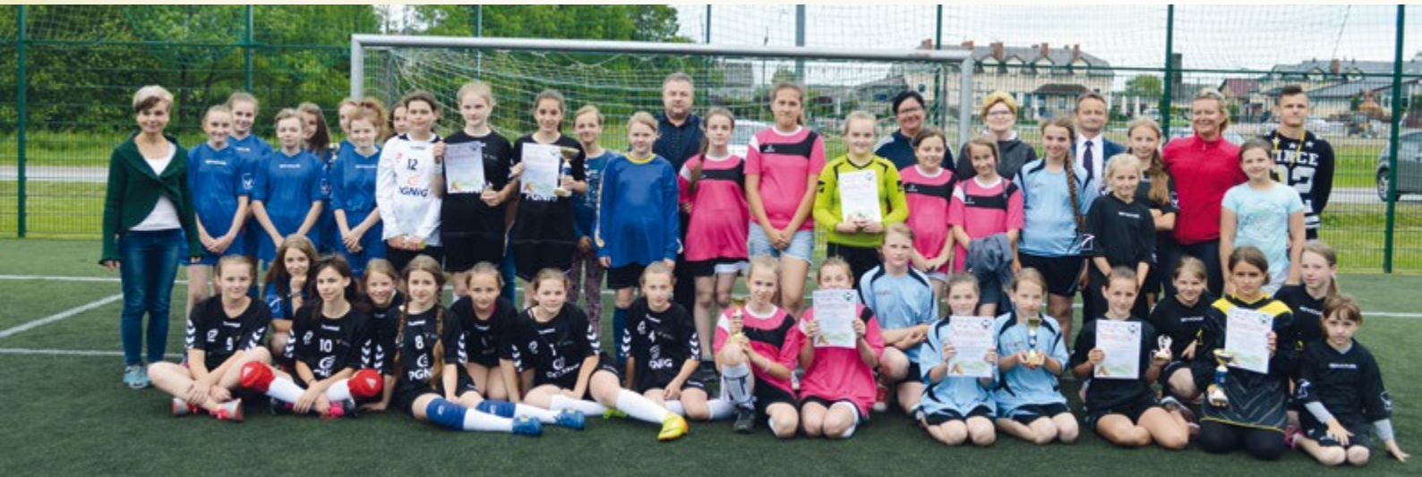
14 czerwca 2017 r. Turniej piłki nożnej uczennic szkół podstawowych o Puchar Wójta Gminy