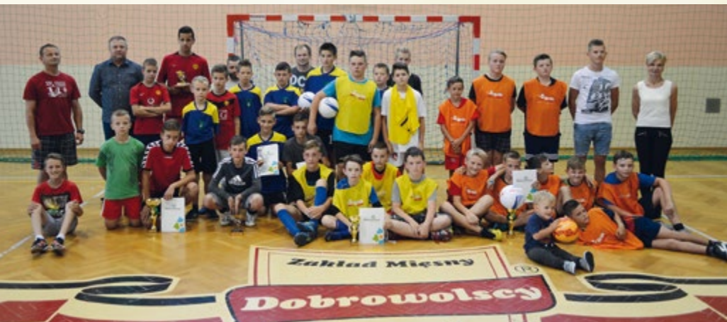
6 sierpnia 2016 r. Turniej piłki nożnej uczniów szkół podstawowych o Puchar Wójta Gminy