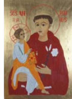
Św. Antoni z Dzieciątkiem. Ikona na desce lipowej 21x30x2,5 cm