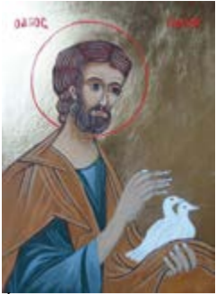
Św. Józef ikona, tempera na desce 15x21,5 cm