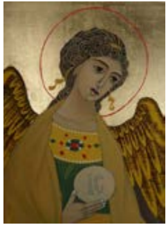
Anioł Stróż, Ikona na desce lipowej 15x20x2,5 cm