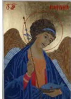
Archanioł Rafael, Ikona na desce lipowej 19x26x2,5 cm