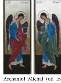
Archanioł Michał (od lewej) i Archanioł Gabriel Ikony pisane temperą jajową na desce lipowej.

Ikony są do nabycia w PRACOWNI IKON Mielec, ul. Sobieskiego 1 tel. 17 7411527 606 389218