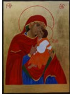
Matka Boska Łopieńska Dobrej Miłości Bieszczadzka