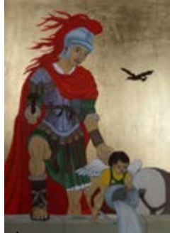
Święty Florian, Ikona na desce lipowej 19x26x2,5 cm