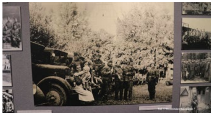
Mielec przed Gimnazjum, kobiety (mieleczanki?) wśród pijących wódkę żołnierzy niemieckich.

Większość z ok. 200 zaprezentowanych na wystawie zdjęć przedstawia niemieckich okupantów w Mielcu i okolicy, którzy czuli się tu całkowicie pewnie, a zwłaszcza w dopiero co wybudowanych przez Polaków nowoczesnych zakładach lotniczych, które przejęli na swoje potrzeby. Niektóre zdjęcia są wręcz sielankowe, a inne raczej groteskowe i wyraźnie kontrastują z biedą stojących w kolejkach po chleb mieszkańców Mielca i nielicznych już Żydów z gwiazdą Dawida na rękawach. Zagadkowe i wymowne jest jedno ze zdjęć Niemców naśmiewających się z bardzo niskiego starca, zapewne w tzw. Lager Mielec. Wspólna fotografia z obdartym skarlatym