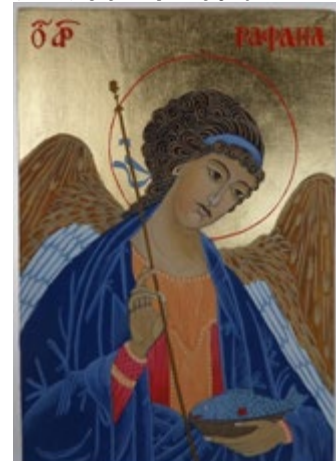
Anioł Stróż, Ikona na desce lipowej 15x20x2,5 cm

oraz własnych i są nie tylko zwykłymi obrazami, ale także przekazem ich wykonawczyni, która przez sztukę wyraża swoją wiarę i wrażenia estetyczne. Istnieje możliwość zamówienia dowolnej Ikony, także własnego wzoru i dedykacji!