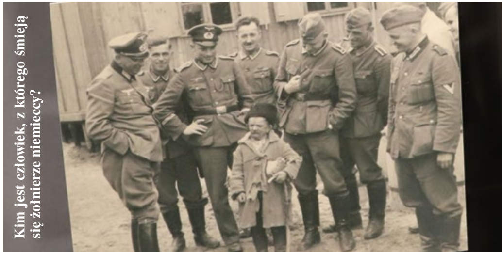
Kim jest człowiek, z którego śmieją się żołnierze niemieccy?