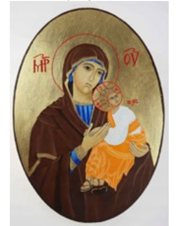
Matka Boska Nieustającej Pomocy. Ikona tempera owal na klejonej desce sosnowej o 24,5 cm x 35 cm x 1,8 cm