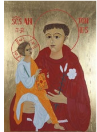
Św. Antoni z Dzieciątkiem. Ikona na desce lipowej 21x30x2,5 cm