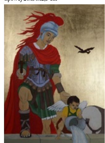
Święty Florian, Ikona na desce lipowej 19x26x2,5 cm