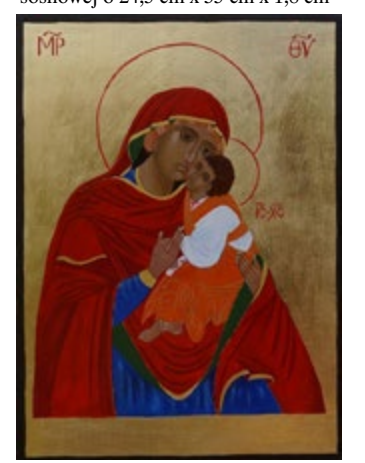
Matka Boska Łopieńska Dobrej Miłości Bieszczadzka