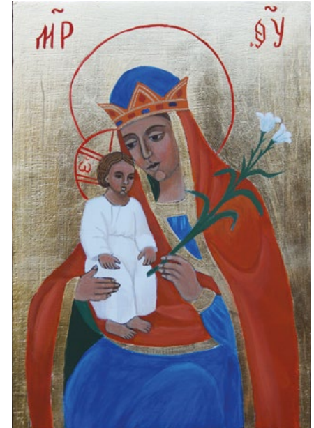
Matka Boska Niewiędnący Kwiat Ikona pisana przez Krystynę Gargas-Gasiewską

Matko Boża niewiędnąca z różą, lilią, gałązkami wciąż żywymi bukietami