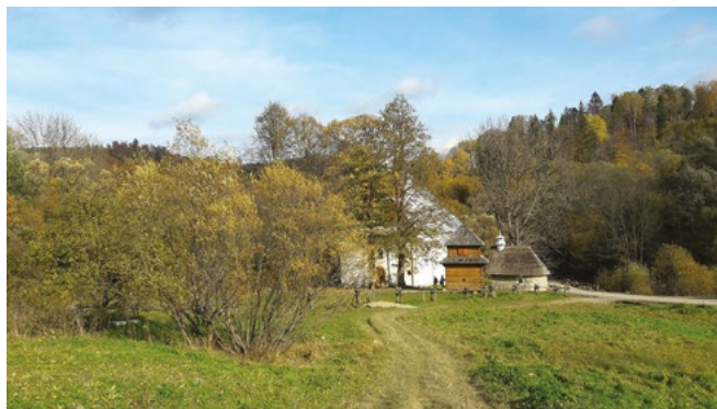
Bieszczady, widok na cerkiew w Łopieniec, fot. autorki.

Wróg zaatakował z lądu, morza i powietrza. Na Warszawę posypały się bomby. Przed atakiem Luftwaffe stolicy broniły pododdziały Ośrodka Obrony Przeciwlotniczej. Niestety, nieskutecznie. Waliły się domy. Ginęli ludzie. A był to dopiero początek. Potem była okupacja, rozstrzeliwania, obozy koncentracyjne, getta, Holokaust.