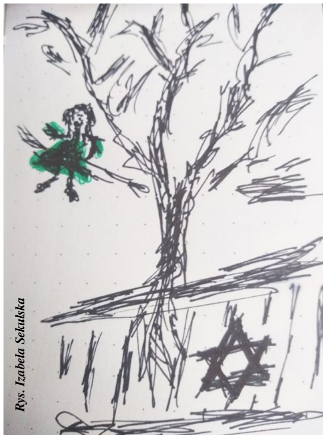
Rys. Izabela Sekulska

– Po co przyszła tutaj ta gojka? O co jej chodzi?– myślała Estera.