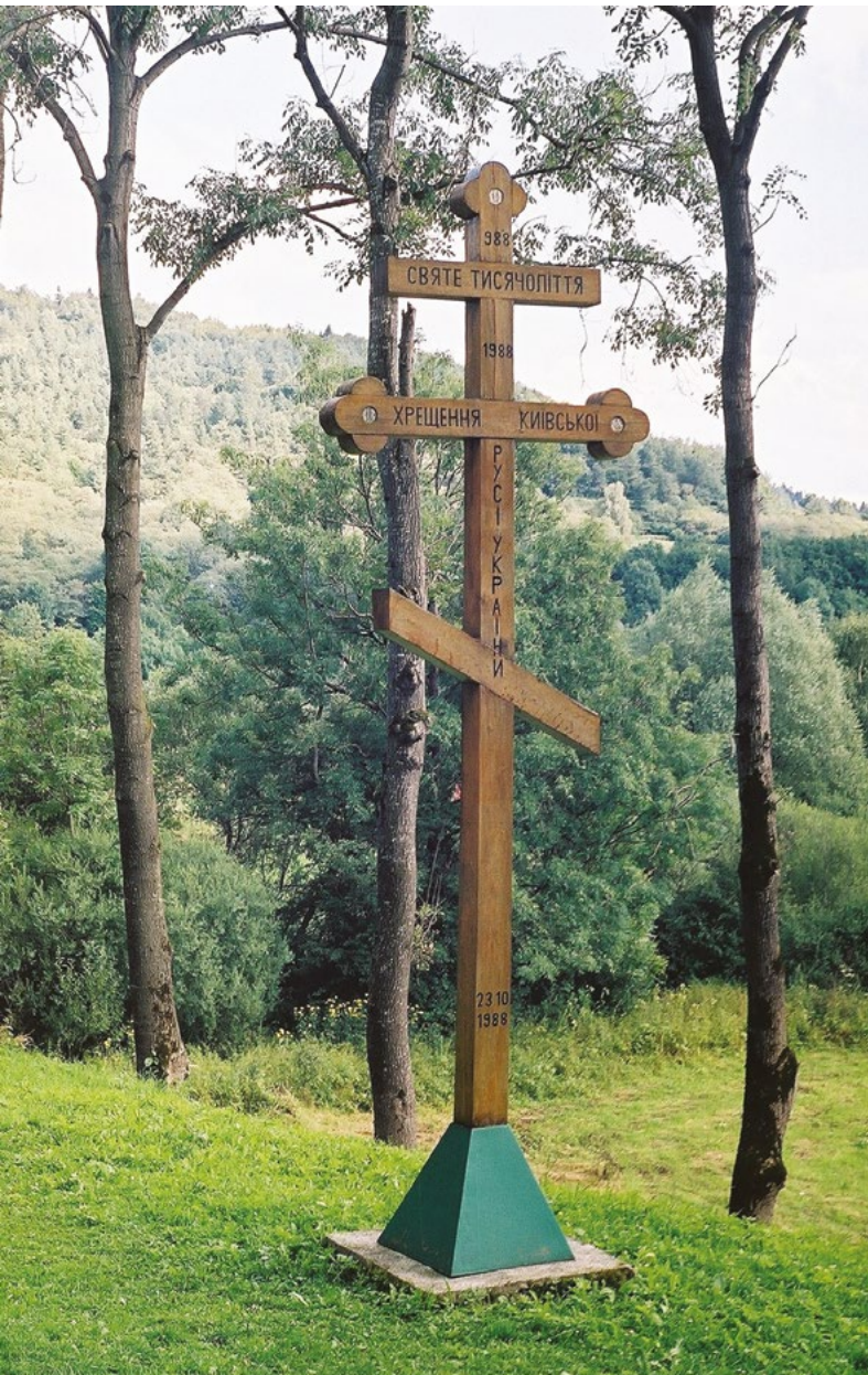
Krzyż przycerkiewny