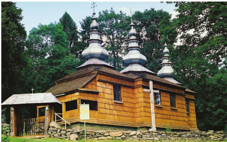
Cerkiew w Rzepedzi

Z całą pewnością niewielkie drewniane cerkwie usytuowane w anturazie niskiego Beskidu czyli Bieszczad są odmiennością zachwycającą i przypominającą o wielokulturowości Polski od wieków. Bieszczadzka ziemia to nie tylko Solina, podróżowanie nad morze nie powinno kończyć się na Trójmieście i tak samo jest w przypadku Bieszczad. Globtroter wyposażony w aparat fotograficzny przebywając na szlaku architektury drewnianej, nigdy nie pożaluje pieniędzy wydanych na aparat, fotografie „uzyskane” w Bieszczadach będą miały to „coś”, czyli to czego nie spotkamy w innym zakątku Polski.