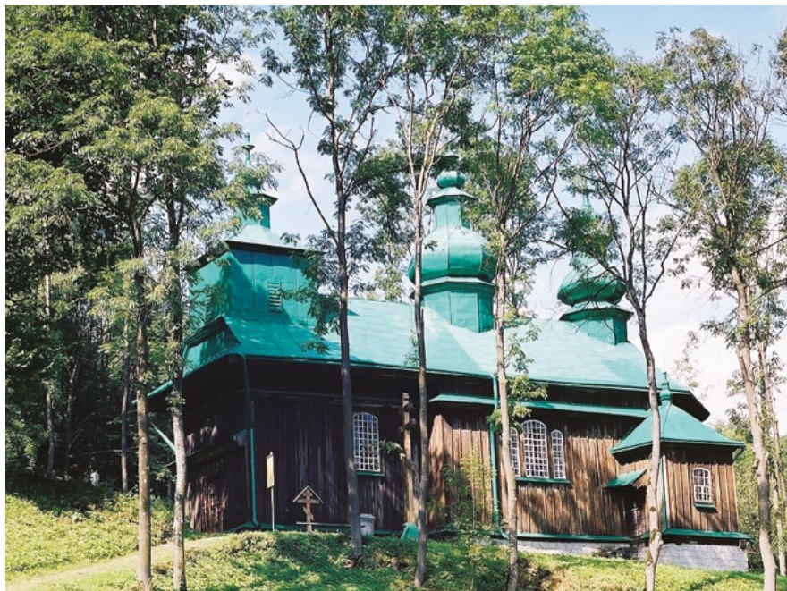
Cerkiew w Szczawnem