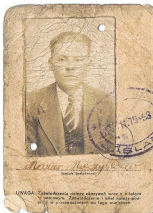
Dokument wydany przez Punkt Przydziału Wojennego w Dębicy