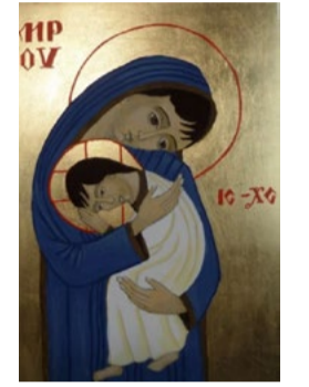
Matka Boska z Dzieciątkiem ikona na desce 15x20x2,5 cm