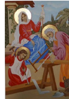
Święta Rodzina przy pracy, ikona na desce lipowej 21x30x2,8