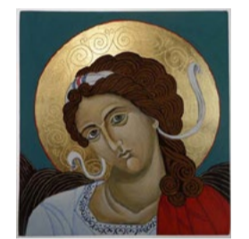
Anioł Stróż, ikona tempera na desce lipowej 16x17x2,5 cm