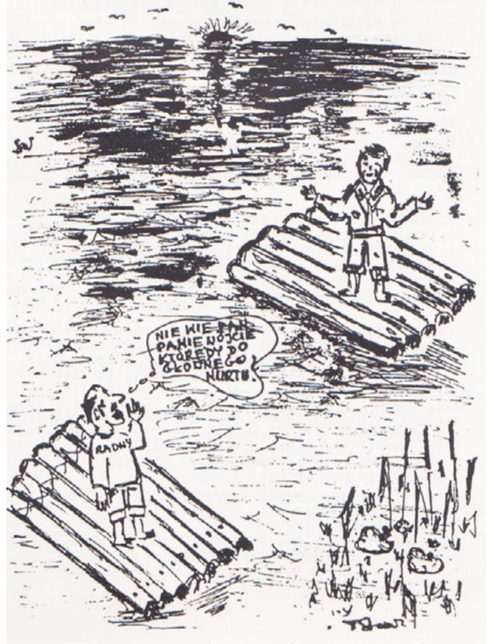
NIE WIE PAN PANIE WÓJCIE KTÓRĘDY DO GŁÓWNEGO NURTU. Rys. Stanisław Marcin Trzpis

„Sesja Rady Gminy” - relacja z sesji z 28 X 1990 r. „Sport” - informacje sportowe z gminy Borowa, opracował Adam Miras. Ukazanie się czasopisma odbiło się szerokim echem w społeczności gminy Borowa, a także w okolicznych gminach. Było to bowiem pierwsze w historii tego typu wydanie. Poprzednio w czasach PRL nikt nie zwracał sobie głowy aby w ten sposób informować mieszkańców gminy o ich bieżących sprawach. Partyjny „Głos Za-