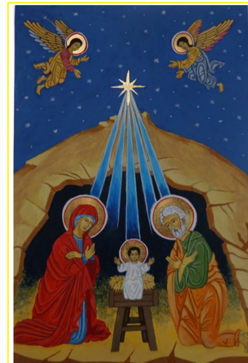
„Boże Narodzenie” - ikona ręcznie pisana, techniką tempery jajowej. Deska lipowa o wymiarach 20 cm x 30 cm x 2,5 cm.