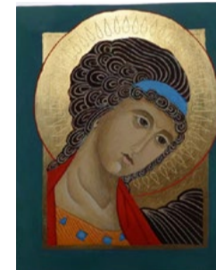
Anioł Stróż, ikona tempera na desce lipowej 14x17,5x2,5 cm