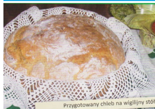
Przygotowany chleb na wigilijny stół

Oferujemy w sprzedaży przewodnik poetycko-artystyczny BIESZCZADZKIE SZLAKI IKON DROGA DO ŁOPIENKI W antykwarjat w Mielcu, ul. Sobieskiego 1 lub jako kup teraz w internecie: https://allegro.pl/oferta/bieszczadzkie-szlaki-ikon-droga-do-lopienki-10019483196