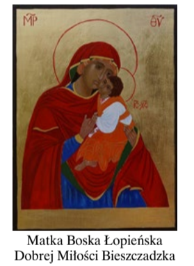
Matka Boska Łopieniska Dobrej Miłości Bieszczadzka