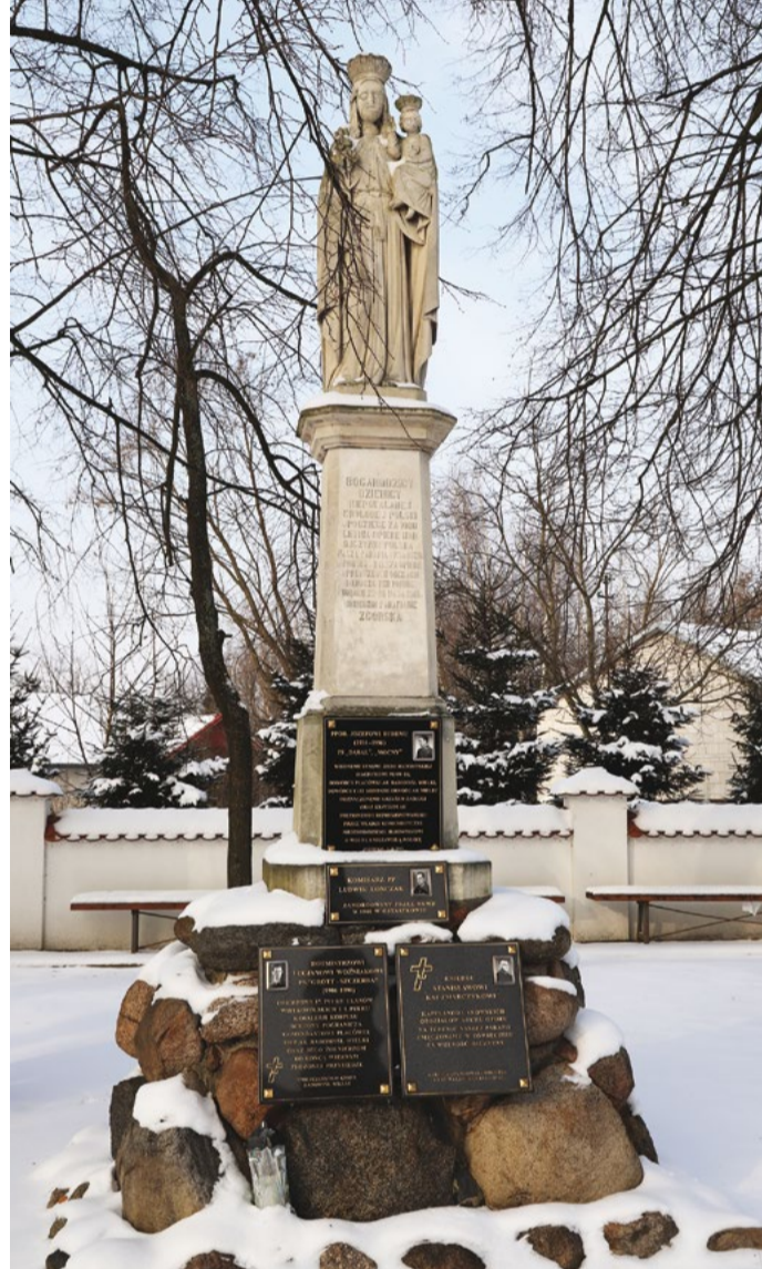
Statua Matki Bożej z Dzieciątkiem i lilią przy kościele w Zgórsku

Opiekunka ludzi dotkniętych chorobą oczu, niewiast pragnących potomstwa, turystów i sportowców. Pod kościołem parafialnym w Zgórsku, przed którym stoi także figura św. Jana Nepomucena w ostatnich dniach II wojny światowej i okupacji niemieckiej miało miejsce zdarzenie określone przez niektórych mianem cudu. Pięcioletnia wówczas parafianka wspomina w ten sposób: (...) Bardzo dobrze pamiętam wydarzenia frontowe z 1944 r. Niemcy zgromadzili mieszkańców, m.in. z Podborza i Zgórska, pod kościołem w Zgórsku. Mieli zamiar pędzić nas na Tamów. Było lato. Część pilnujących nas Niemców kąpała się w rzece w okolicach mostu. Nagle nadleciały rosyjskie samoloty i zaczęły zrzucać na nich bomby. Większość zginęła na miejscu. Szczątki ciał dolatywały pod kościół, a ludzie tam zgromadzeni zaczęli krzyknąć próbując jednocześnie znaleźć jakieś schronienie. Mój tatuś wraz z sąsiadem postanowili, że wracamy do domu, bo i tak wszystko jedno gdzie zginie. Panika była tak duża, a pewność śmierci tak oczywista, że nikt, chociaż każdy próbował się jakoś