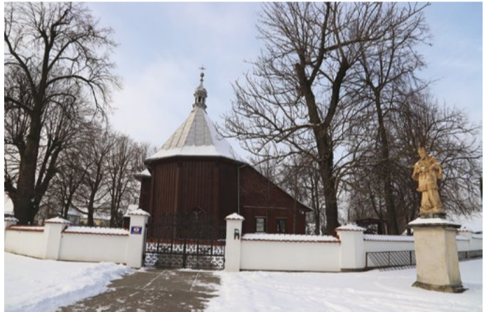
Figura św. Jana Nepomucena przed kościołem w Zgórsku