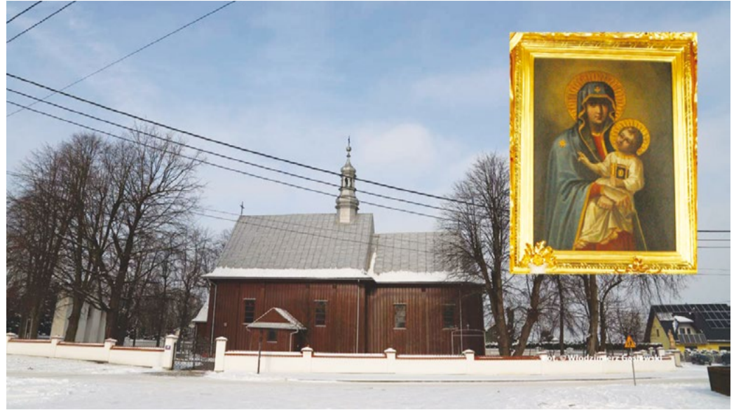
Kościół parafialny w Zgórsku i Matka Boska Śnieżna z ołtarza głównego