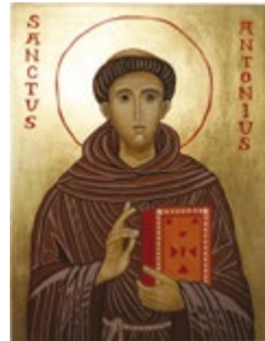
Święty Antoni, Ikona tempera jajowa na desce lipowej 15x20x2,8 cm