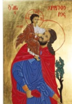
Święty Krzysztof, Ikona tempera jajowa na desce lipowej 20x30x2,8 cm