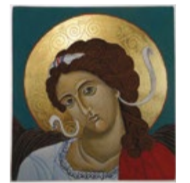
Anioł Stróż, ikona tempera na desce lipowej 16x17x2,5 cm