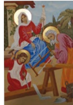
Święta Rodzina przy pracy, Ikona na desce lipowej 21x30x2,8