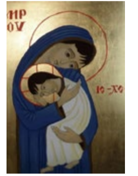
Matka Boska z Dzieciątkiem ikona na desce 15x20x2,5 cm