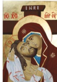
Matka Boska Pieta, Ikona tempera jajowa na desce lipowej 17,5x26x2,8 cm