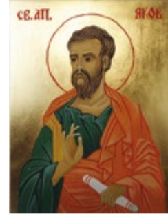
Święty Jakub, Ikona tempera jajowa na desce lipowej 15x20x2,8 cm

Wytwórnia Sprzętu Komunikacyjnego WSK PZL Mielec Polski Czerwony Krzyż Klub Honorowych Dawców Krwi przy WSK PZL Mielec