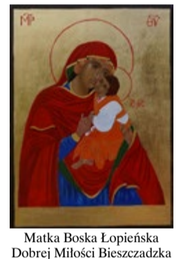
Matka Boska Łopieńska Dobrej Miłości Bieszczadzka