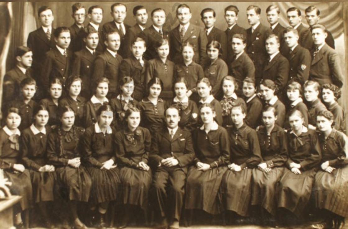
Chór „Melodia”. Mielec, 1936