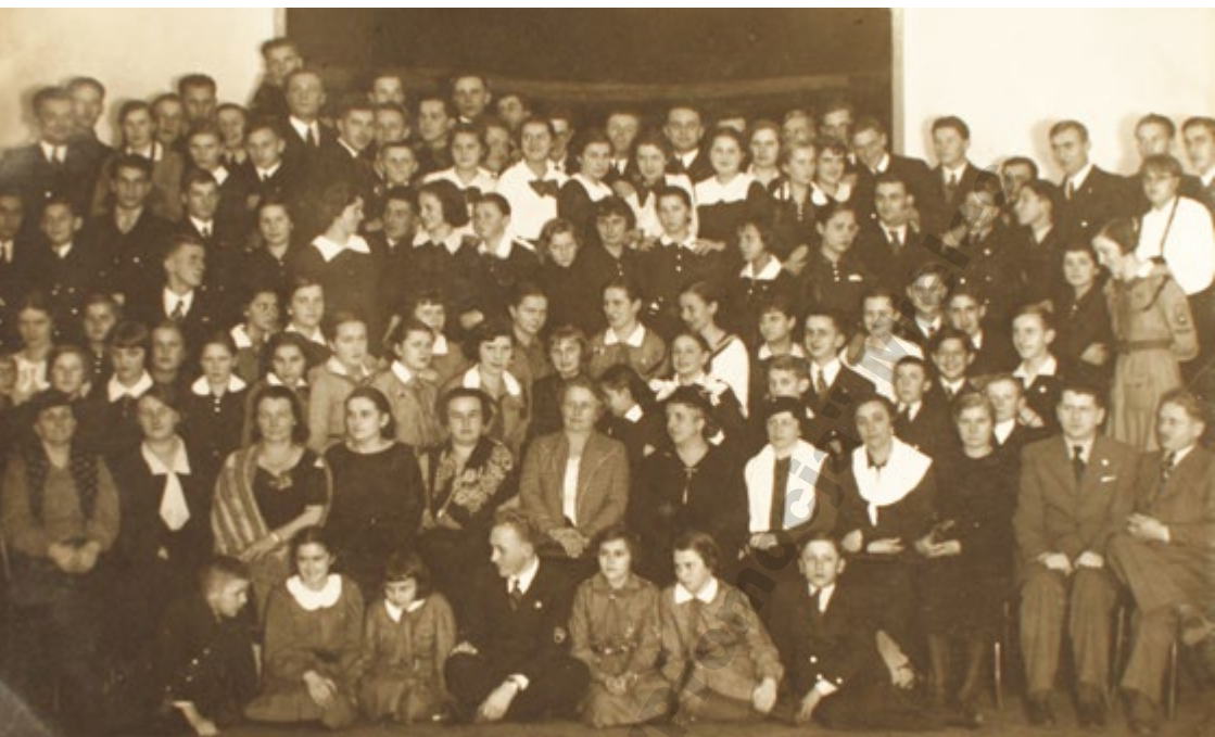
Zabawa Harcerska. Mielec, 1936