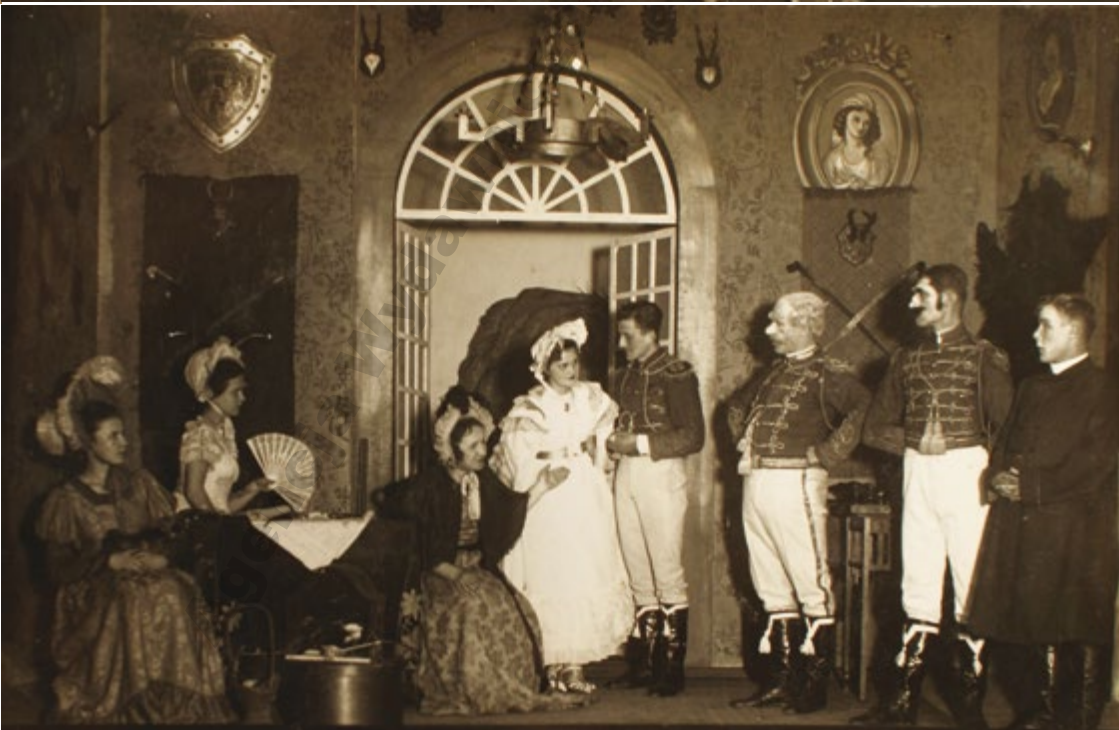
„Damy i Huzary”, Mielec, 1936.