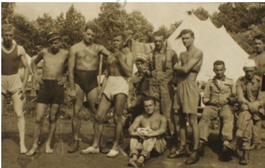
Mieleccy gimnazjaliści w Starym Sączu. Lata trzydzieste