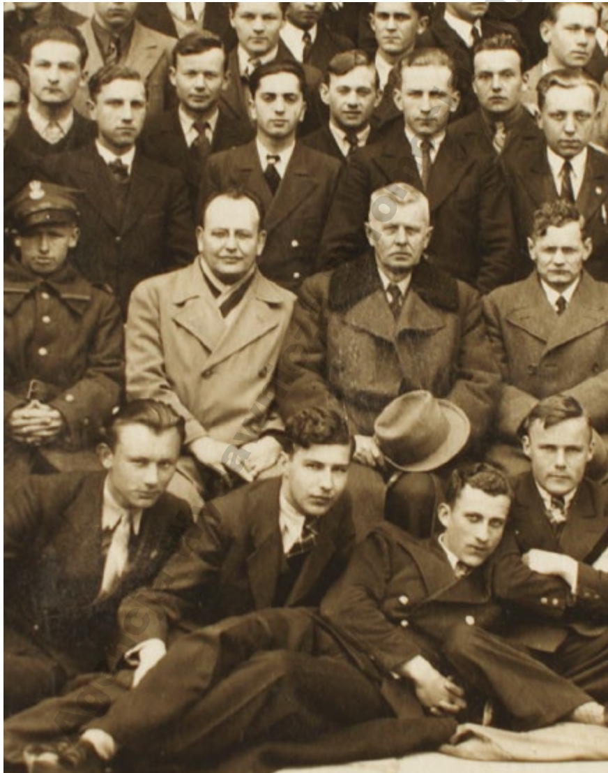
Mielczanie na wycieczce. Prawdopodobnie w Krakowie. Lata trzydzieste