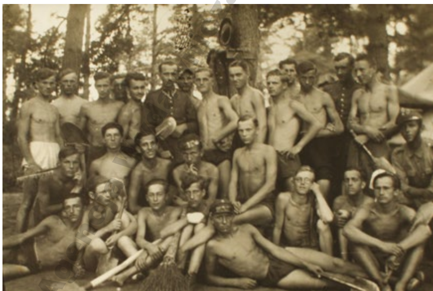
Fotografia z okresu szkoły wojskowej