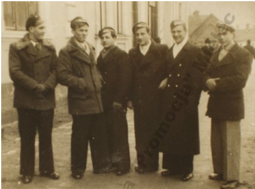
Grupa gimnazjalistów na ulicach Mielca, 15 stycznia 1938 r.