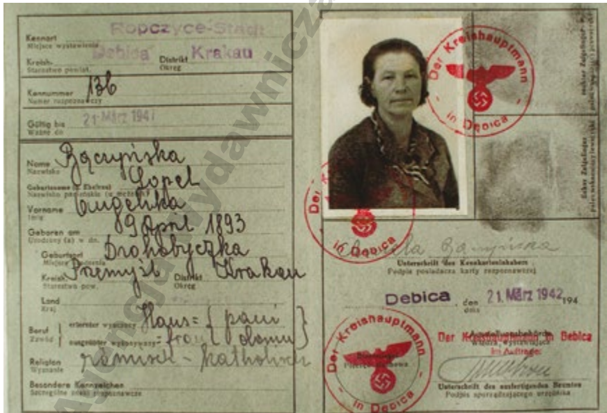
Kenkarta matki Bączyńskiego, wydana w Dębicy w 1942 r.